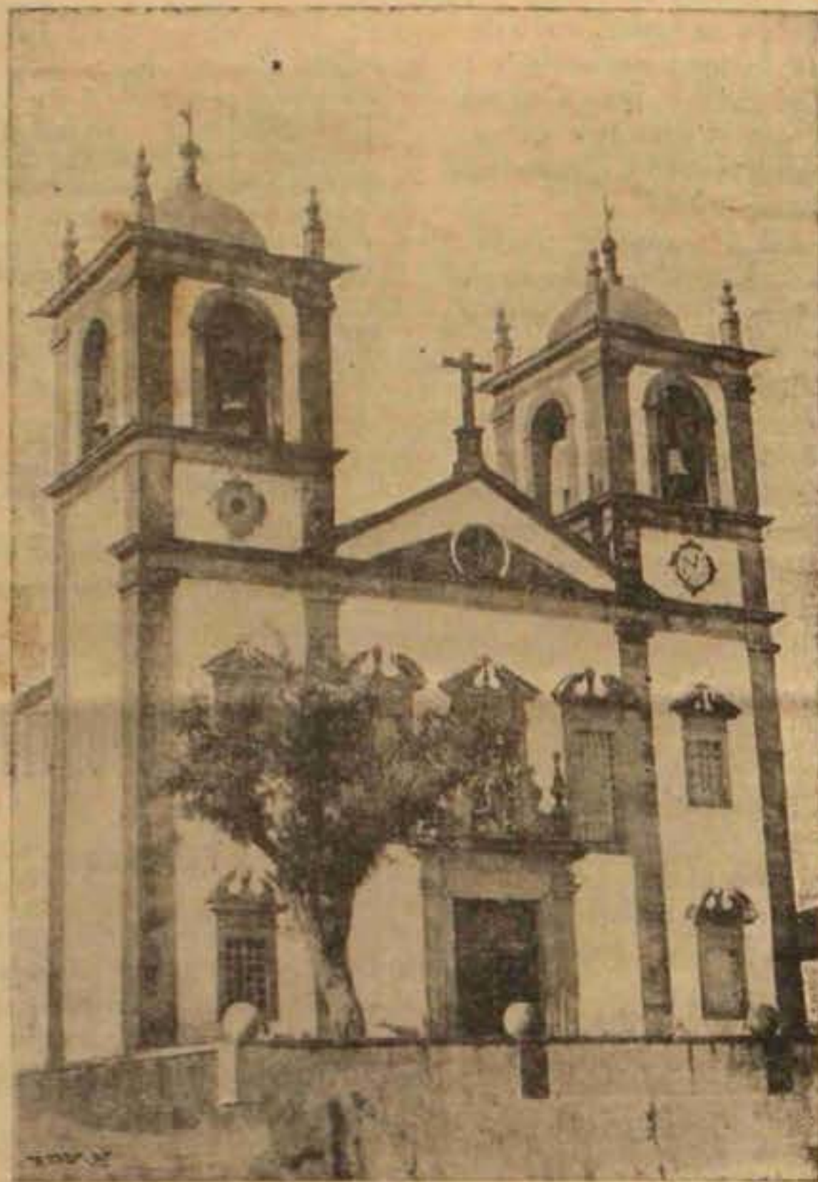
OLIVEIRA DO HOSPITAL — Igreja Matriz