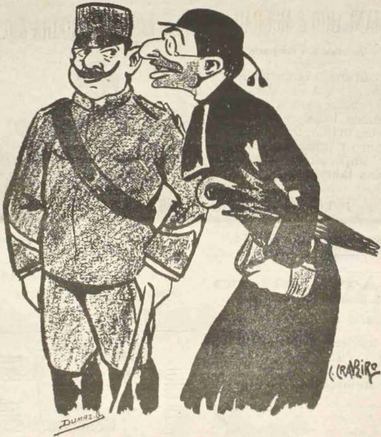
Sessenta dias d'indulgencias ao meu amigo se houver bordoadá teza...