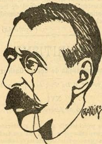
Eça de Queiroz