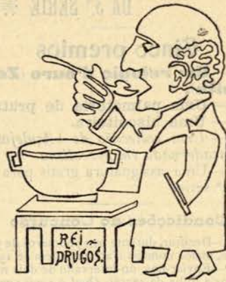
Desenho de um só traço

N'estas circumstancias, que diabo quer o meu amigo que lhe diga do seu passado ? Que o tem passado agarrado á chucha ; está claro, não é necessario sêr-se feiteiceiro para o adivinhar !