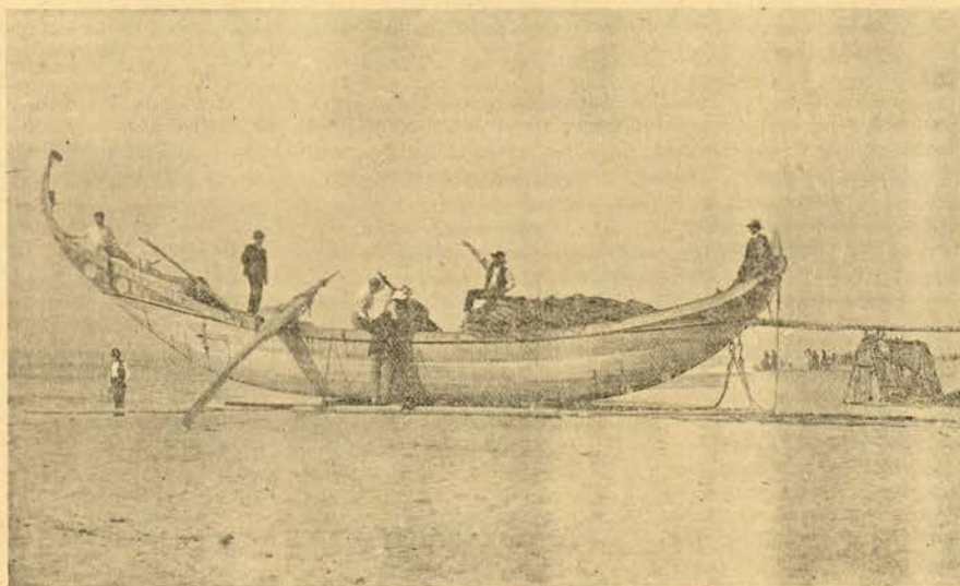
Costa da Torreira — Barco de pesca

oculistas, os logares nos animatographos são disputados a murro, em extensas bichas que interrompem o transitio, e o bom humor revela-se na indiferença com que á procura das diversões nos periodicos, os leitores passam sobre a prosa transcripta de Mr. Galtier.