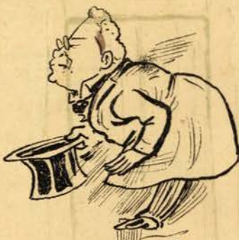
Para dizer bem.