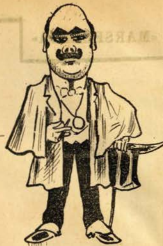
Porque seria feio não ir.