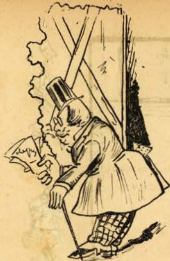
Porque os bilhetes eram caros.