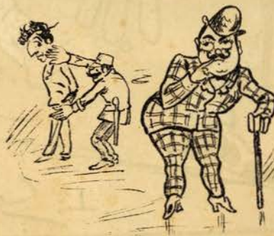
Quando eramos apalpados, algum, de olhos em alto exclamou— Isso tomara eu! ...