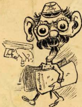
A policia reatou as suas relações conosco...