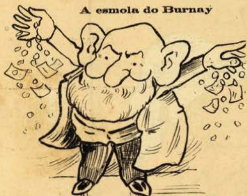
O que os pobres julgaram ver no Burnay.