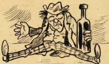
Acabo de beber o vinho India e tão bom o achei, por vida minha que quem queira findar a quadra finde-a... pois não posso escrever mais uma linha.