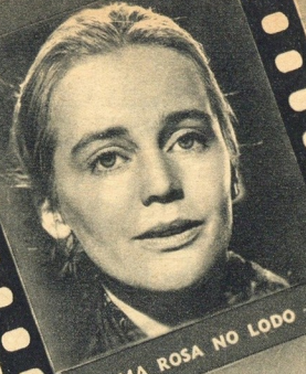
UMA ROSA NO LODO