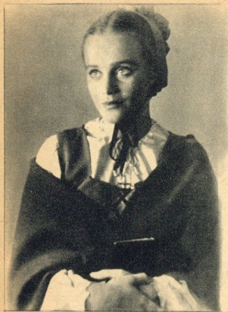
Os esforços de Maria Schell no estudo da arte de representar permitiram-lhe desempenhar uma das principais figuras do «Fausto», de Goethe, num teatro de Viena.