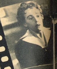
UMA BOCA SONHADORA