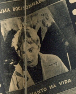
QUANTO HÁ VIDA