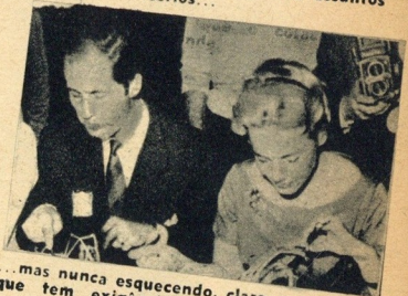
...mas nunca esquecendo, claro, o estômago, que tem exigências que o coração não entende...