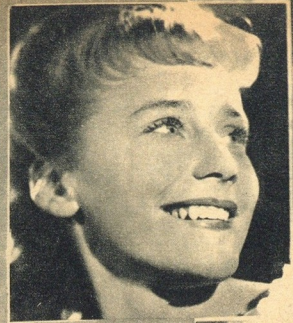
UM DIA VIRA