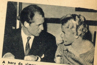
A hora do almoço para dois apaixonados é o único tempo em que eles falam de assuntos sérios...