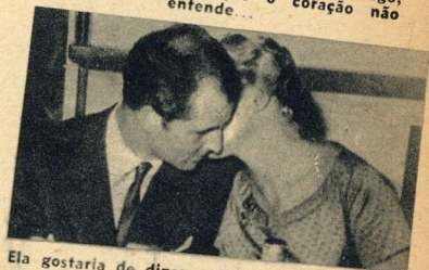
Ela gostaria de dizer: «Amo-te, querido», em voz alta, para que toda a gente ouvisse, mas a prudência aconselhou-lhe um meio mais agradável...