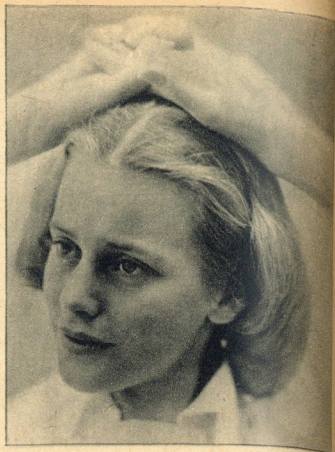
Os fotografos começaram a interessar-se pelas extraordinárias qualidades fotogénicas de Maria. Este é um retrato do célebre artista Cecil Beaton.

fazer valer as suas aspirações artísticas.