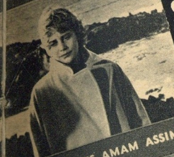
AS MULHERES AMAM ASSIM