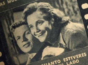
QUANTO ESTIVERES DO LADO