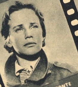
A ÚLTIMA PONTE