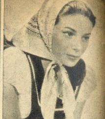
Amorosa e terna em «Vindima Trágica»