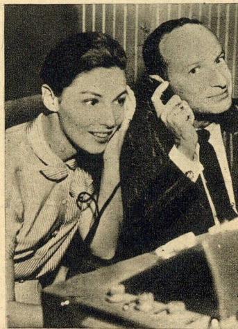
A jovem actriz italiana não deixa, pelo facto de ser casada e mãe, de se comportar como uma brincalhona de se lhe tirar o chapéu. Esta imagem mostra-nos Pier a ouvir uma gravação do diálogo com a alegria de uma criança diante de um brinquedo...

Ela cumpriu a sua palavra. Não só escrevia mas também a mãe e ela falavam com ele pelo telefone. Como a saúde do pai melhorasse, a felicidade na sua nova tarefa aumentou. Por fim, a película foi