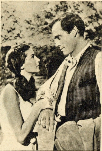
Em «A Vindima Trágica» Pier contracena com Mel Ferrer. O filme constitui uma emotiva mensagem de amor e assinala mais uma brilhante interpretação da inigualável actriz.

O que lhe reserva o futuro, ninguém o pode saber. Ela agora tem uma triplíce carreira, que é a de mulher, mãe e actriz e espera poder cumprir os três sem conflitos durante longos anos.