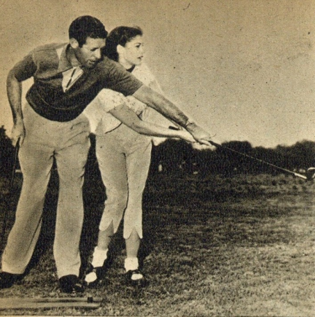
Uma «vedeta» que se preza não descarta as práticas desportivas. Além de outros desportos, Pier pratica o «golf», que aprendeu com um dos principais campeões da modalidade na América: B!!! Roberts.

dada por terminada e a mãe e ela tomaram lugar a bordo de um gigantesco avião prateado que, rapidamente atravessando o Atlântico, os transportou para junto do pai.