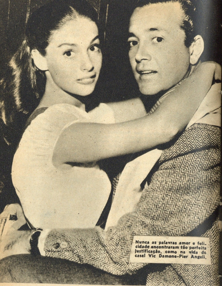
Nunca as palavras amor e felicidade encontraram tão perfeita justificação, como na vida do casal Vic Damone-Pier Angeli.