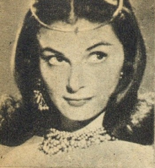
Sedutora em «O Cálice de Prata»