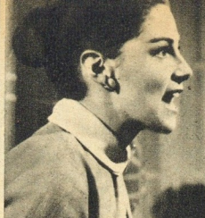
Revoltada em «Marcado pelo Ódio»