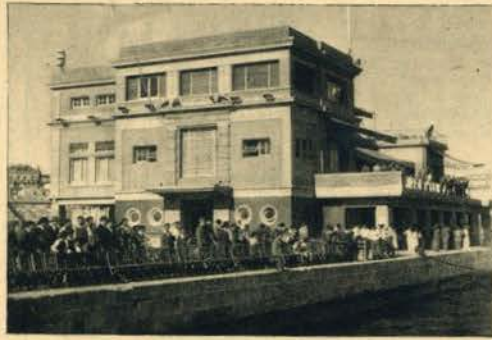
Um aspecto da sede do Real Club Náutico da Corunha no decorrer de uma das regatas