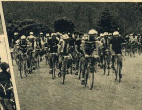
A caravana vai devorando quilómetros sobre quilómetros, insensível à fadiga