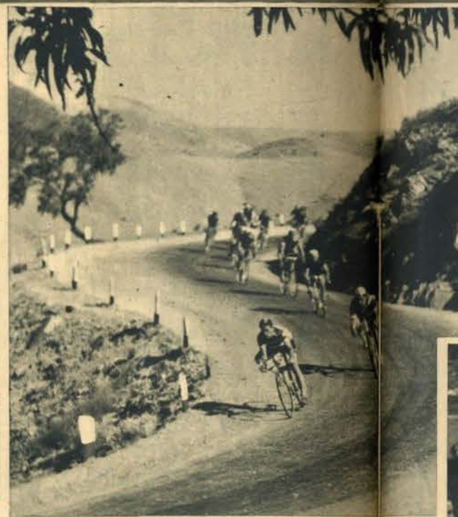
Na etapa Chaves-Bragança o pelotão esfrangalhou-se. Nesta imagem, um sportinguista comanda as operações