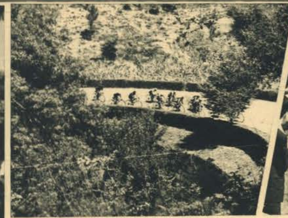
Os corredores, em pelotão compacto, esfrangalham-se sem pressas...