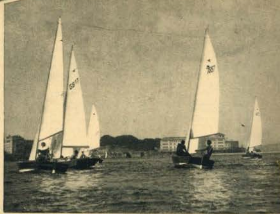
Dois formosos aspectos das regatas entre portugueses e espanhóis

D E novo e com merecimento absoluto o desporto da vela conquistou brilhante triunfo no estrangeiro.