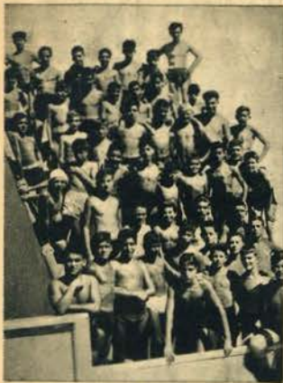
NATAÇÃO — A primeira jornada dos Campeonatos Regionais de natação, levada a efeito no último domingo, no Estádio Náutico do Sport Algés e Dafundo, foi bem a jornada da gente moça.