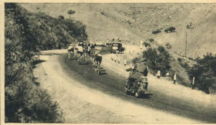
Sempre a estrada, serpente imensa que os campeões vencem...