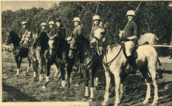
As duas equipas e o árbitro alinhadas antes de começar o encontro

Q UANDO no ano passado assistimos em Mafra a um desafio de «Indoor Polo» e verificámos o entusiasmo do público por esta curiosíssima modalidade do desporto equestre, lembramo-nos de alvitar a realização de jogos em Lisboa, para que os adeptos que aqui residem tivessem oportunidade de assistir a uma das mais emocionantes competições hípiacas.