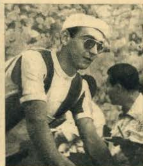
VALMITJANA, o argentino que já abandonou a prova