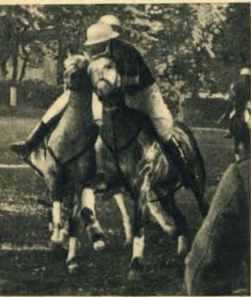
Uma fase cheia de movimento e de vigor