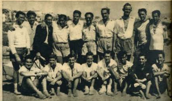
Os velejadores da Mocidade Portuguesa, Brigada Naval e Cadetes da Armada, concorrentes ao campeonato nacional de «sharpiés»