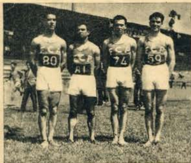
A equipa do F. C. Porto que nos campeonatos regionais teve comportamento magnífico conquistando oito títulos