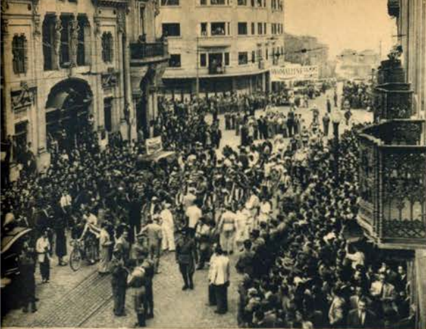
Antes da partida, os corredores concentram-se em frente da sede do nosso prezado colega «Diário do Norte»

Os clichés da «Volta a Portugal» são feitos com películas e chapas LUMIÈRE