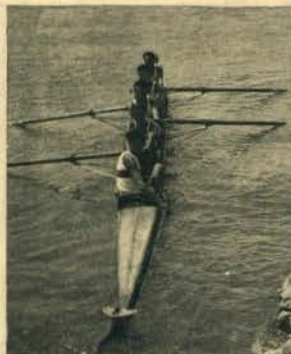
Os Ferroviários do Barreiro vencedores da taça «5 de Outubro»