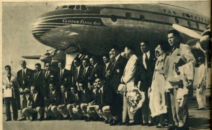
A turma de honra do Sport Lisboa e Benfica, campeã nacional e latina, partiu para a África, onde, por certo, se cobrirá de glória, com exhibições pujantes e convincentes.