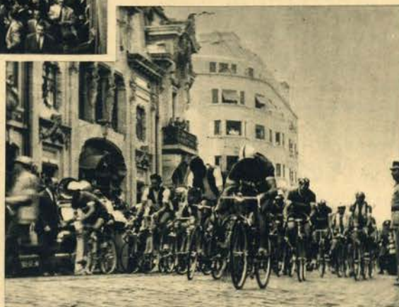
As primeiras pedaladas da Volta de 1950. O público incita os rapazes e deseja-lhes sorte e felicidades para tão longa caminhada