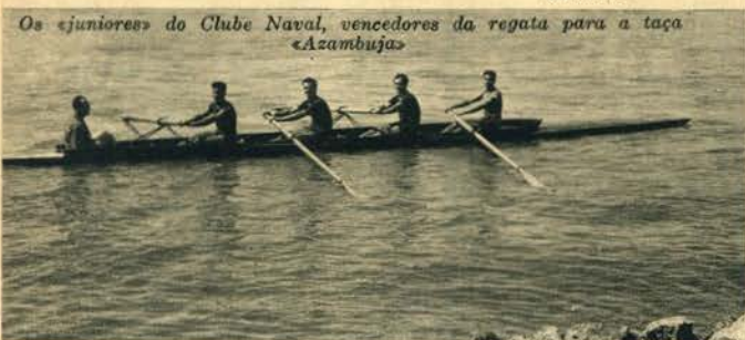
Os «juniores» do Clube Naval, vencedores da regata para a taça «Azambuja»