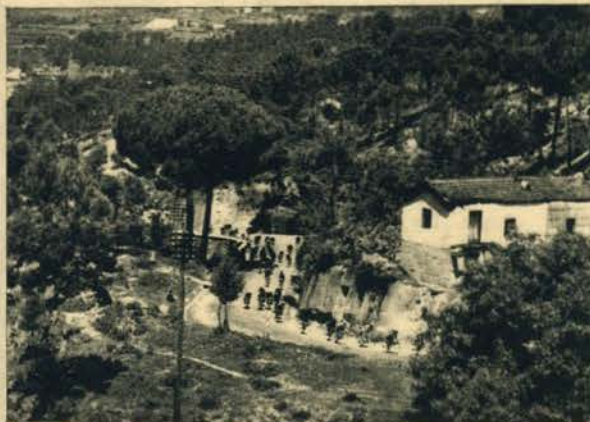
Em pleno esforço: Os gigantes da estrada pedalam com vigor... a caminho da meta... que não está longe. Portugal é, de facto, muito lindo!