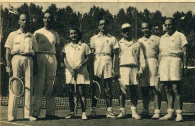
Com desusado entusiasmo disputaram-se, na Curia, os torneios de ténis. Esta, a equipa do Sport Lisboa e Benfica, vencedora do Campeonato Nacional.