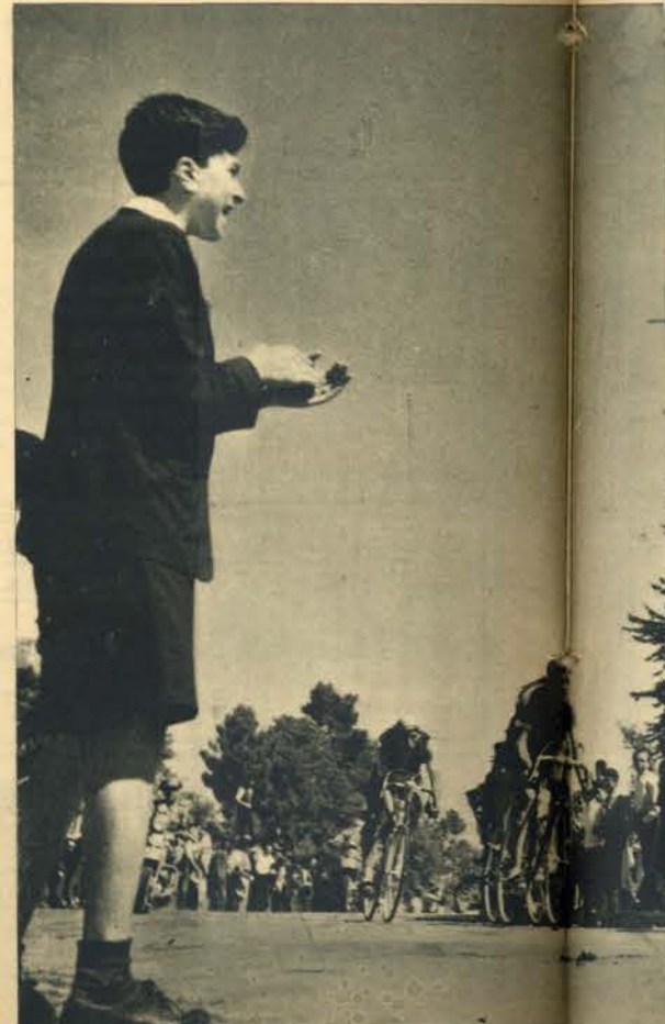
Afrontando com destemor a poeira e o calor, os ídolos do pedal, são saudados vibrantemente pelos seus admiradores. Repare-se na expressão do «miúdo» que aplaude... em força.