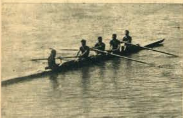
O «4» de Principiantes do Clube Naval, vencedor da sua regata