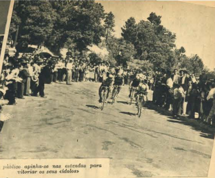
O público apinha-se nas estradas para vitoriar os seus ídolos