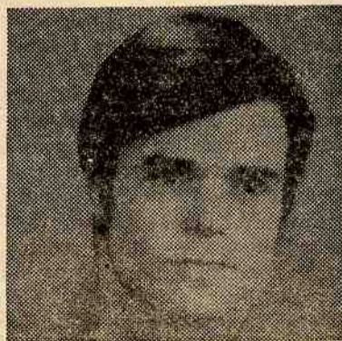
...ele que não podia ver os Pides... mas tantos que foram acompanhá-lo.

«Nos primeiros dias, ainda me convenci que ele tinha saído para o estrangeiro, mas, quando ouvi a notícia na rádio convenci-me