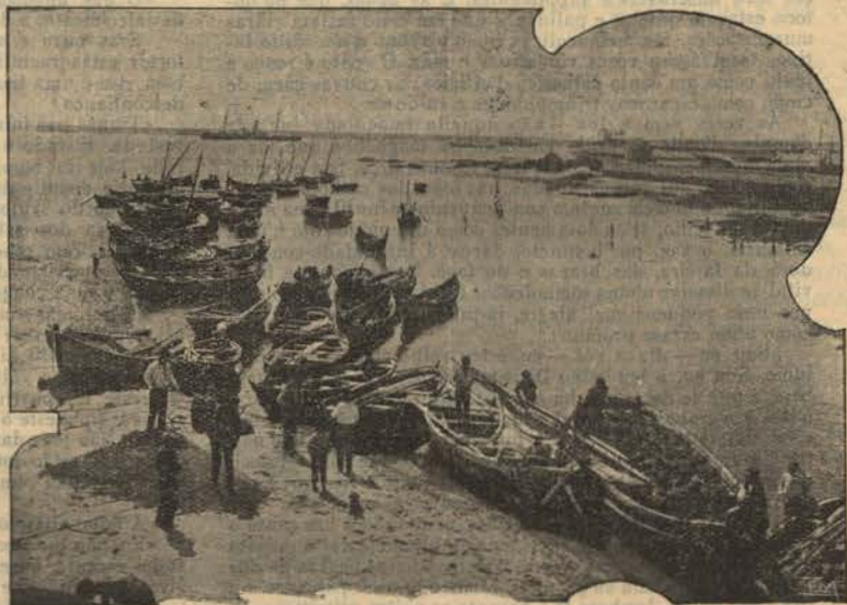
LEIXÕES — Interior do porto

de largada. Muitos e pequenos botes e canoas singravam na espelhada agua, impelidos pela força mascula dos seus tripulantes. E aos lados, como guardas d'esse original abrigo marítimo, os molossos graníticos estendiam-se inertes, oferecendo a sua forte resistencia ás furias dos banhos de Neptuno.