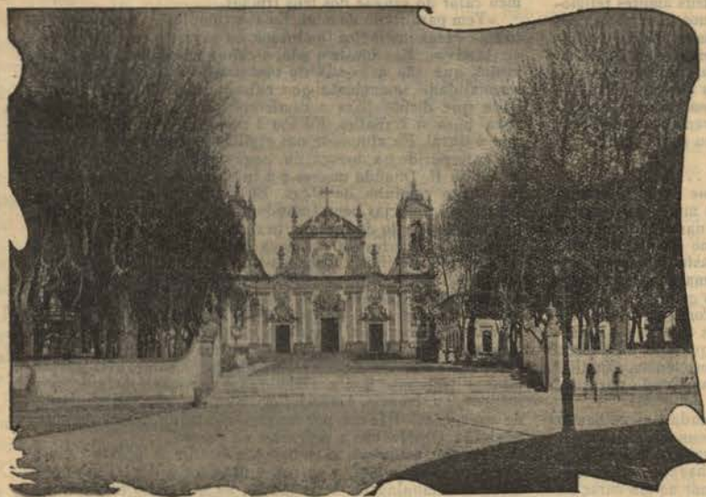
MATOSINHOS — Igreja

Creio que toda a gente sabe que esse homem foi um dos grandes estadistas de Portugal, depois que os celebres 7.000 bravos do Mindello desembarcaram na historica praia dos Ladrões.