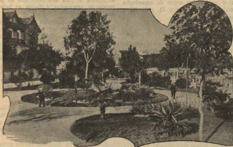
LEÇA DE PALMEIRA - O Jardim