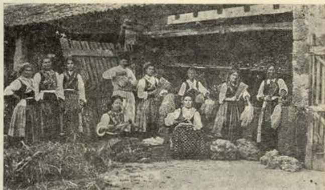
UMA 'ESPADELADA' EM VIANA DO CASTELO

De momento a momento, uma risada larga, em falsete, grita, cobre o ruído