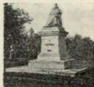
MONUMENTO A BROTERO

que repousam os restos da Rainha Santa, e onde se guarda essa precioso reliquia que Teixeira Lopes, talhou com retoques de genio, a escultura admiravel da mesma rainha, em cujo rosto, transluz uma expressão de bondade