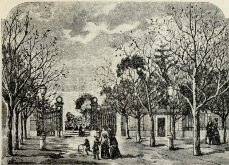
O ANTIGO PASSEIO PUBLICO

Se é tarde em que ha tourada no Campo Pequeno, o movimento atinge então o seu auge, circundando principalmente o coreto a ouvir a musica enquanto não chega a romaria; e desde o cyclista ao elegante «Roll-Roys» ou ao luxuoso «Metallurgique» incluindo as carruagens de todas as formas e feitios, conduzindo os diversos representantes da sociedade portugueza, ricos e pobres dão á rua central o aspecto mais interessante e querido da Cidade.