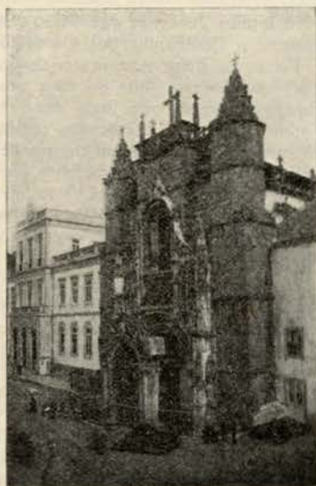
mulher, IGREJA DE SANTA CRUZ ladeada

Mais adiante o Arco de Almedina, velho portico da cidade, em cujo topo se ergue o antigo brasão de Coimbra, um calix tendo dentro uma figura de