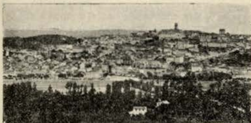
Coimbra toda em descantes É uma guitarra a chorar.