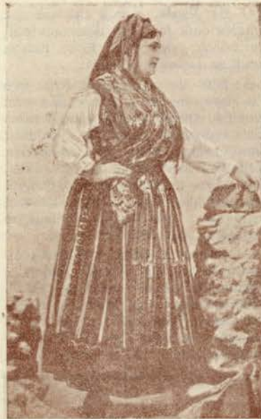
MULHER DE VIANA

Garrida e candida mulher de Viana, rasga o teu vestido, e despreza esta