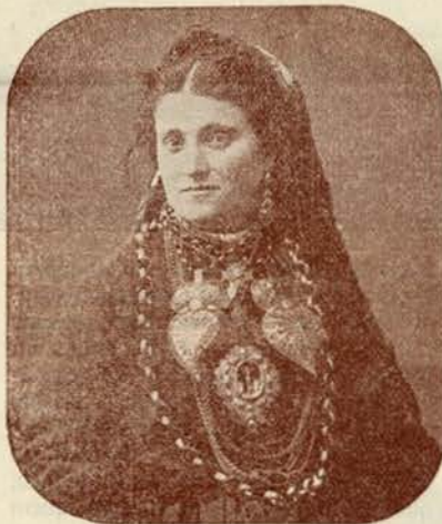
MULHER DE CAMPO ADORNADA PARA A ROMARIA

braguez enramado de cravos e d'espigas os homens tem nos olhos arabes essa expressão languida e grave que reflectem as pupilas dos ruminantes. E elas, que esbeltas, harmoniosamente talhadas, com pequenas cabeças, coradas e morenas de Ceres rusticas; espessos cabelos castanhos ondulando sob os chapelinhos negros de borlas e plumas que prendem, nas nucas, os lenços variegados, deixando pender as pontas, de cada lado, até aos pescoços redondos e curtos; bocas escarlates de papoulas; olhos aveludados, pretos e humidos como auroras sylvestres; os côlos fartos de rolas, modelados