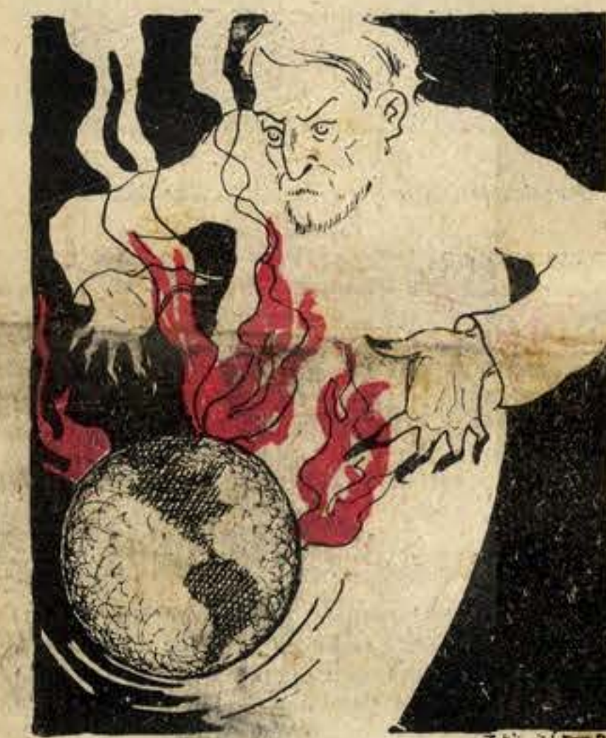
Alquimista maquiavélico da morte e da guerra

O raid não se fez — pela falta de recursos da nossa imprensa. No fundo alegrámo-nos. Não sabemos porque — sentimos um vago terror moral por