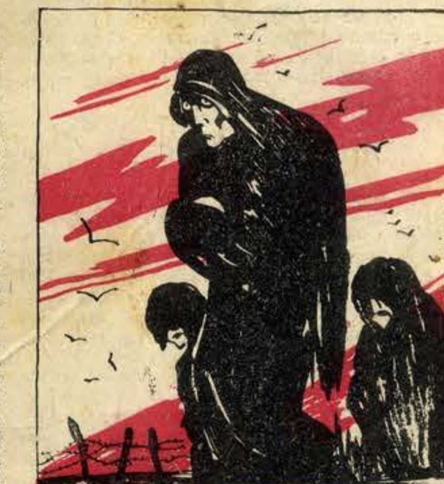
Aquêle homem deixou atrás de si um rastro de sangue e de miséria