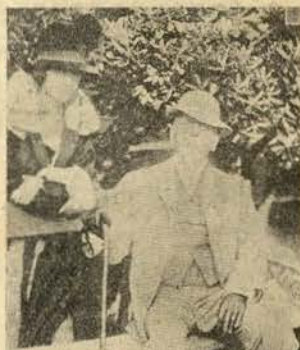
Zaharoff e sua mulher a Duquesa de Villafranca