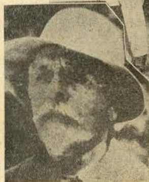
Zacarias Bastieos Zaharoff