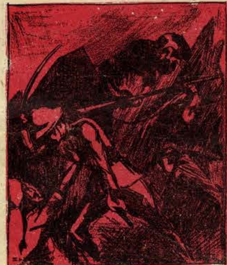
A rebeldia dos rifenhos foi um dos seus melhores negócios

directores viram logo o alto interesse jornalístico desse raid — e começaram a tentar reunir os fundos necessários para as despesas, que não eram ligeiras, dada a super-abundância de imprevistos com que devíamos contar. Transpirou logo para os cafés o nosso projecto e durante uns dias falou-se intensamente nesse assunto. Foi quando um individuo de que os frequentadores da «Brasileira» do Chiado se recordarão pela certa, um estrangeiro que se dizia grego, jornalista... e jogador, —