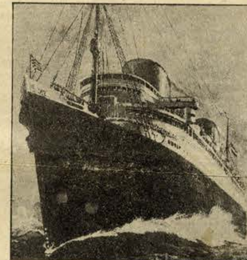
Luxuosos transatlânticos transportam-nas a Buenos Ayres e Rio de Janeiro

se levantou e subiu a escada do lado da Misericórdia.