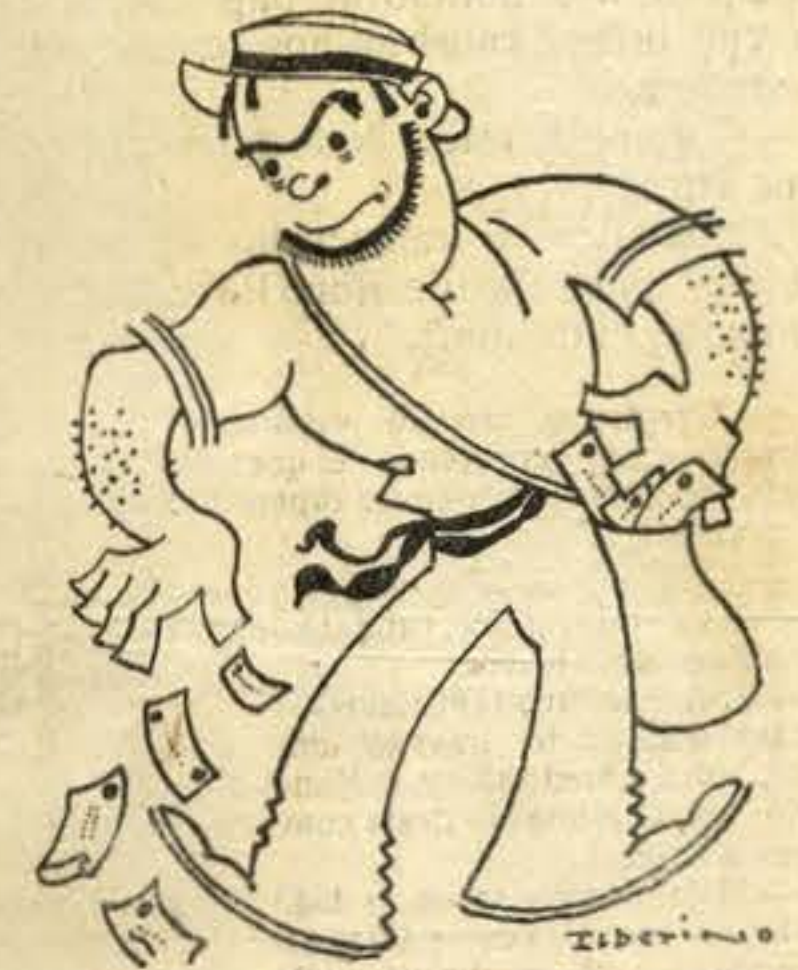
Todo o povo, de boa-fé, passava as cédulas falsas

circulação bastara para as tornar irreconhecíveis, enodoadas, gordurosas, destroçadas, quando não destruidas por completo. O publico e a imprensa protestaram — mas só foram escutados por uma entidade: pela dos falsificadores. Pouco depois surgiram milhares de cedulas falsas. O publico, ignorando a sua legal proveniencia porque as via novinhas, brilhantes, higienicas, ao passo que as outras estavam encadernadas em cêbo, acolheu-as com entusiasmo. E' que os falsificadores... eram honestos — relativamente, já se vê. Para bem