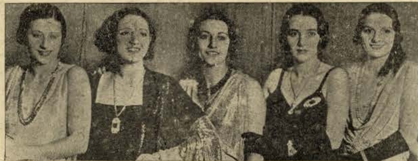
Alguns dos mais lindos e sedutores manequins vivos que se exibiram

Não! Mas como nenhuma influência tem a minha opinião nos designios da Humanidade, — e da