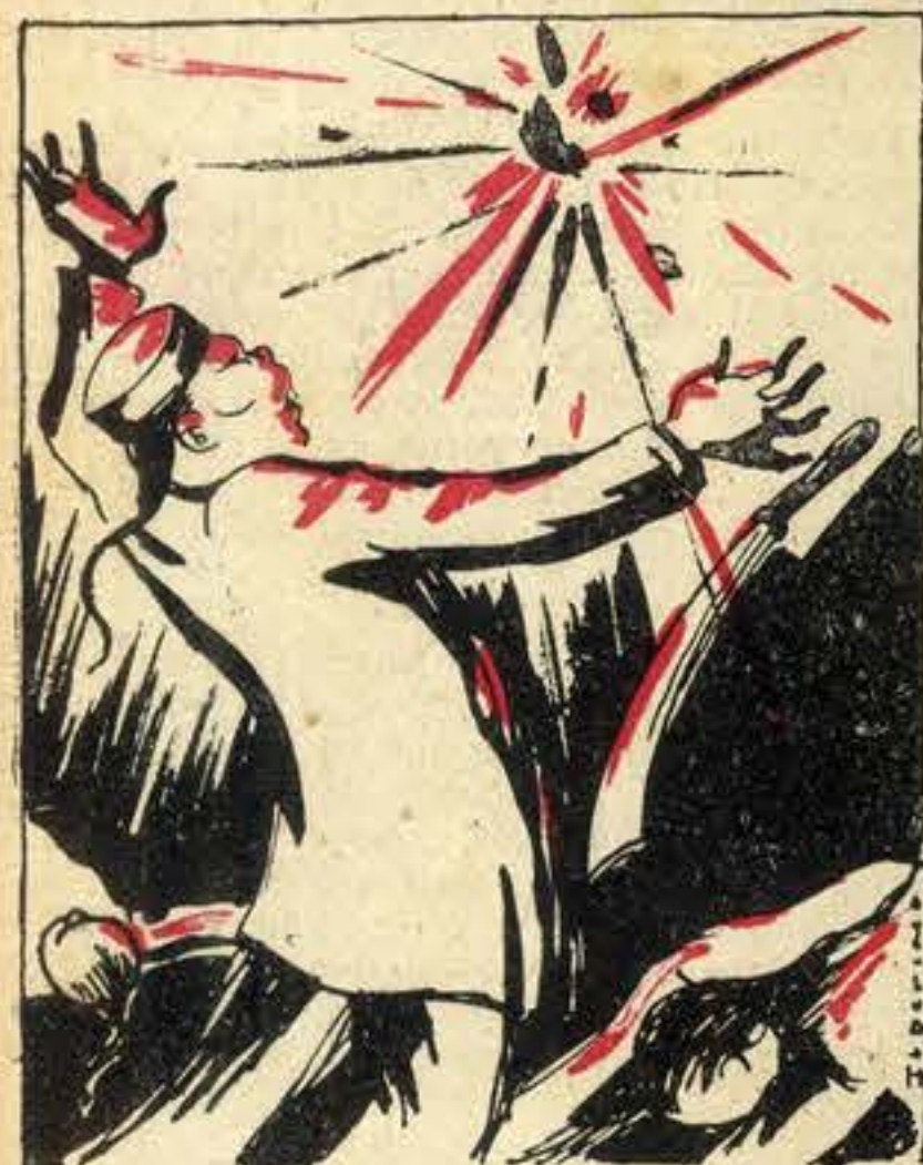
Foi ele quem incendiou o odio amarelo na China

Era já um lugar comum jornalístico as revoluções nas repúblicas ibero-americanas. Países jovens, exuberantes de vida, pletóricos de riqueza, apressadamente ansiosos de uma perfeição social para a qual lhes falta experiência política e calma de espírito — a sua freqüente intranquilidade pode ser diagnosticada por «histerismo próprio da idade»... A estatística gráfica que publicamos no nosso n.º 11, com o mapa da América e as respectivas datas revolucionárias desde o princípio do século, que provocou um lisonjeiro êxito, tanto no nosso público como no estrangeiro, facilitava a impressão conjunta dessa nevrose; mas o mais importante dessa estatística era a coincidência única de quase todas as vinte repúblicas ibero-americanas (com excepção, já se vê, do avançadíssimo Uruguay) terem sofrido uma epilepsia político-sangrenta no actual ano de 1930. Era inédita