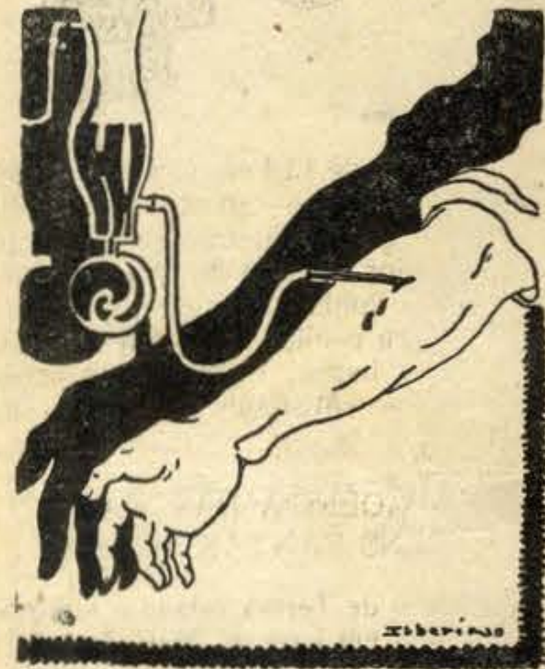
Sangue mais caro do que o ouro para as transfusões de doentes caros

nimos que dão a própria vida aos centímetros cúbicos.