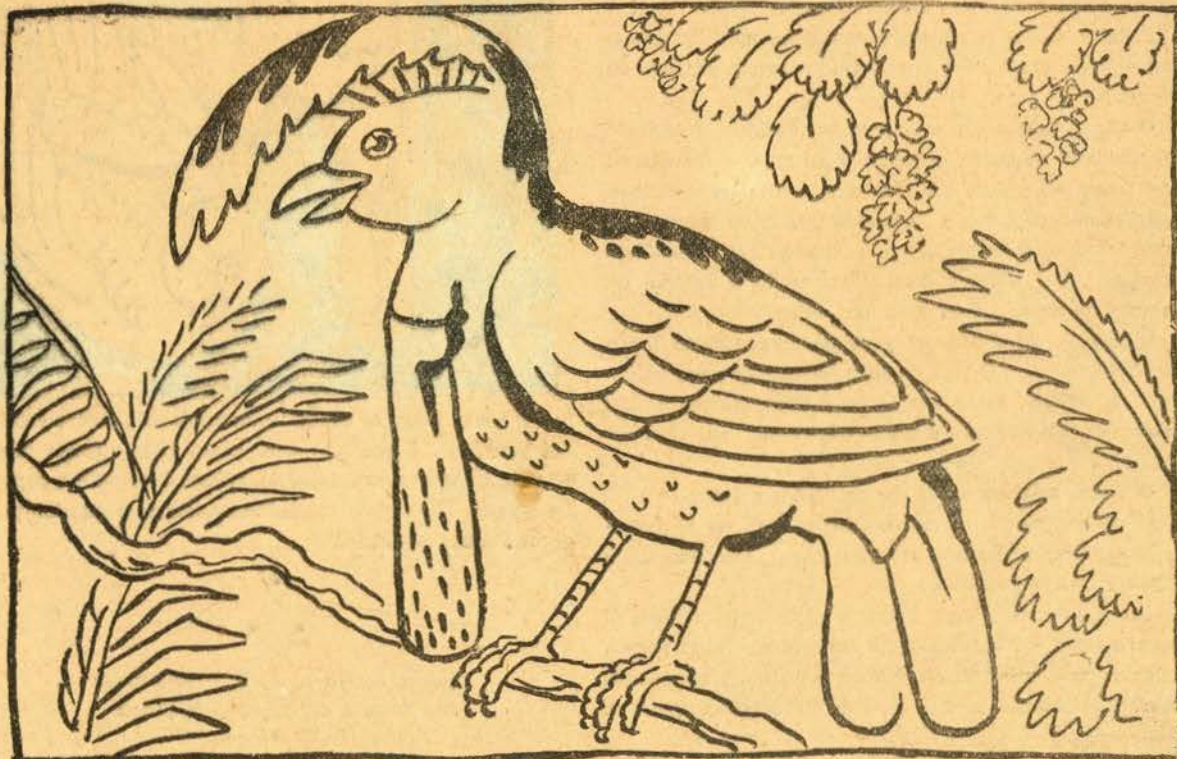
O CÉFALOPTERO ENFEITADO — (Cephaloptero ornatus)