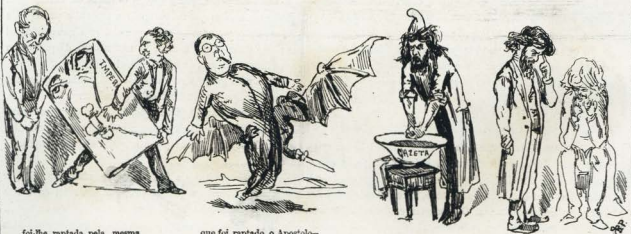
foi-lhe reptada pela mesma forma.