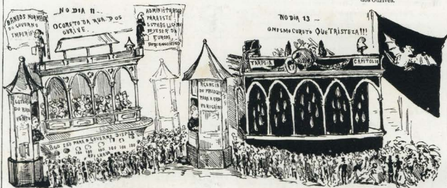
O Correto, os attentados, etc., tomaram proporções gigantantes; — A alegoria da morte do Kiosque foi de sua eguare para a pasta que elle não largou.