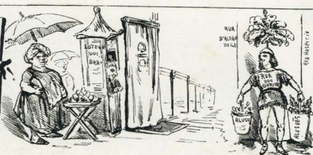
Mercedite, kiosquillo, reposteirito e telegraphite agudas — parecem que foram as causas.