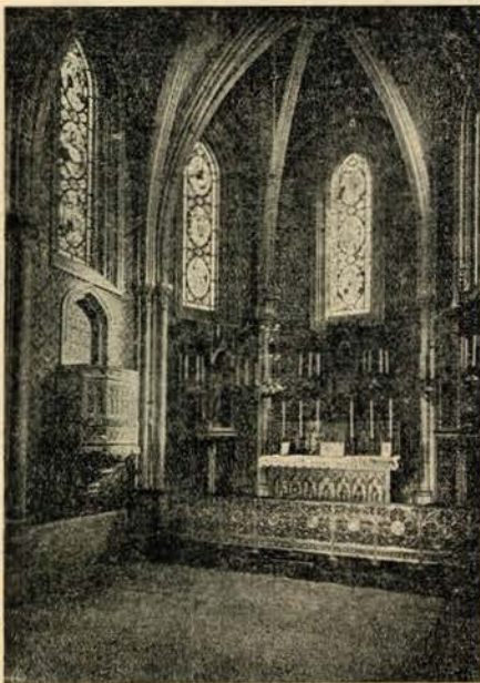
Interior da Capela-Monumento do Coração de Jesus, no Pôrto