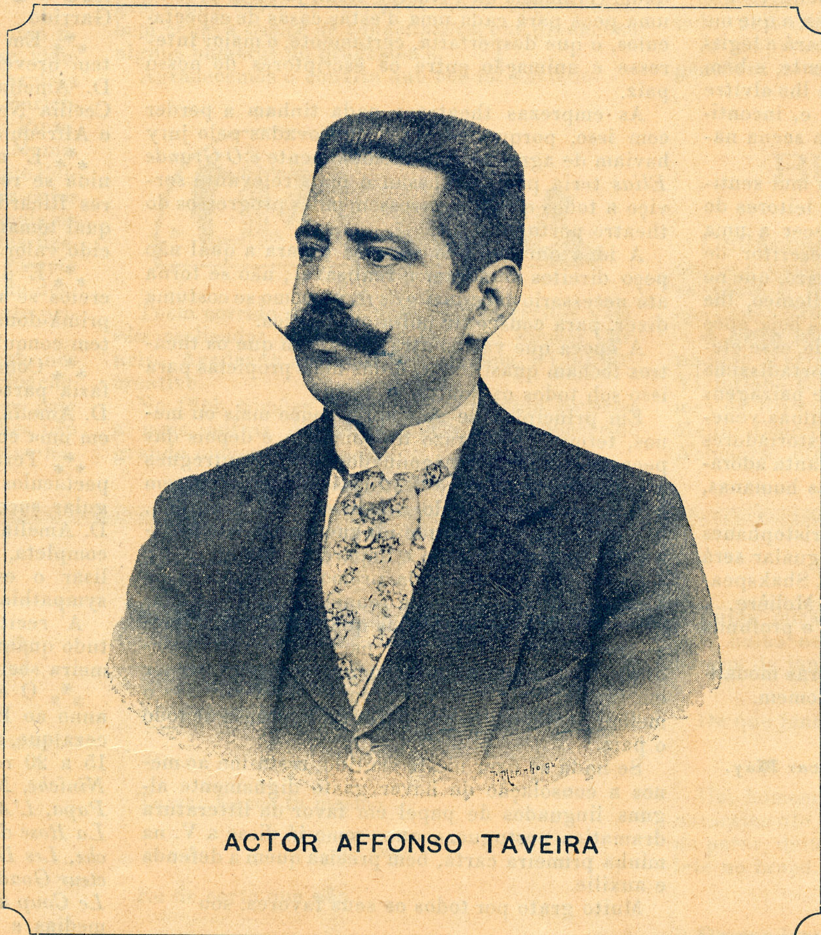
ACTOR AFFONSO TAVEIRA