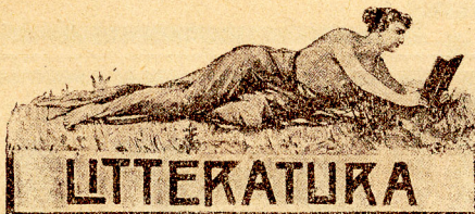
Antonio José da Silva (o Judeu)

Um admiravel retrato da dona da casa, pintado por Gustave Courtois, parece pertencer áquella época.