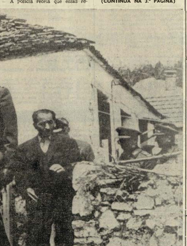
Como «O Comércio do Porto» largamente referiu, registou-se, no Noroeste da Grécia, um violento abalo de terra, que causou vítimas e importantes estragos materiais. Mal teve conhecimento da catástrofe, o rei Constantino dirigiu-se às regiões devastadas, que percorreu demoradamente

JANINA (Noroeste da Grécia), 3 — O novo regime militar da Grécia incumbiu o Exército de dirigir directamente as gigantescas operações de socorro e auxílio, nesta área devastada por um sismo no noroeste do país, onde pelo menos dezoito mil pessoas ficaram sem lar.