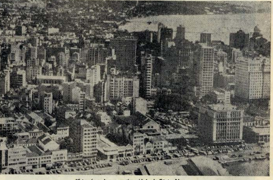
Vista aérea da progressiva cidade de Porto Alegre

PARIS (França), 3 — Cairam ontem, à noite, cerca de vinte centímetros de neve na região dos Alpes. Os serviços meteorológicos prevêem para hoje continuação de neves nas regiões montanhosas. — R.