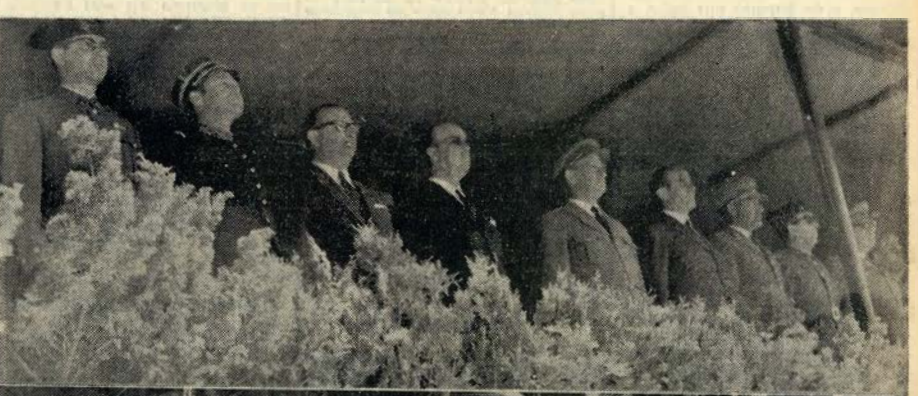
Três aspectos das comemorações do Dia da G. N. R., no quartel da Bela Vista: de cima para baixo, vê-se um friso das autoridades na tribuna de honra; depois, o desfile da companhia de alistados; e, por fim, uma fase dos exercícios de ginástica durante o desenvolvimento dos guardas de instrução