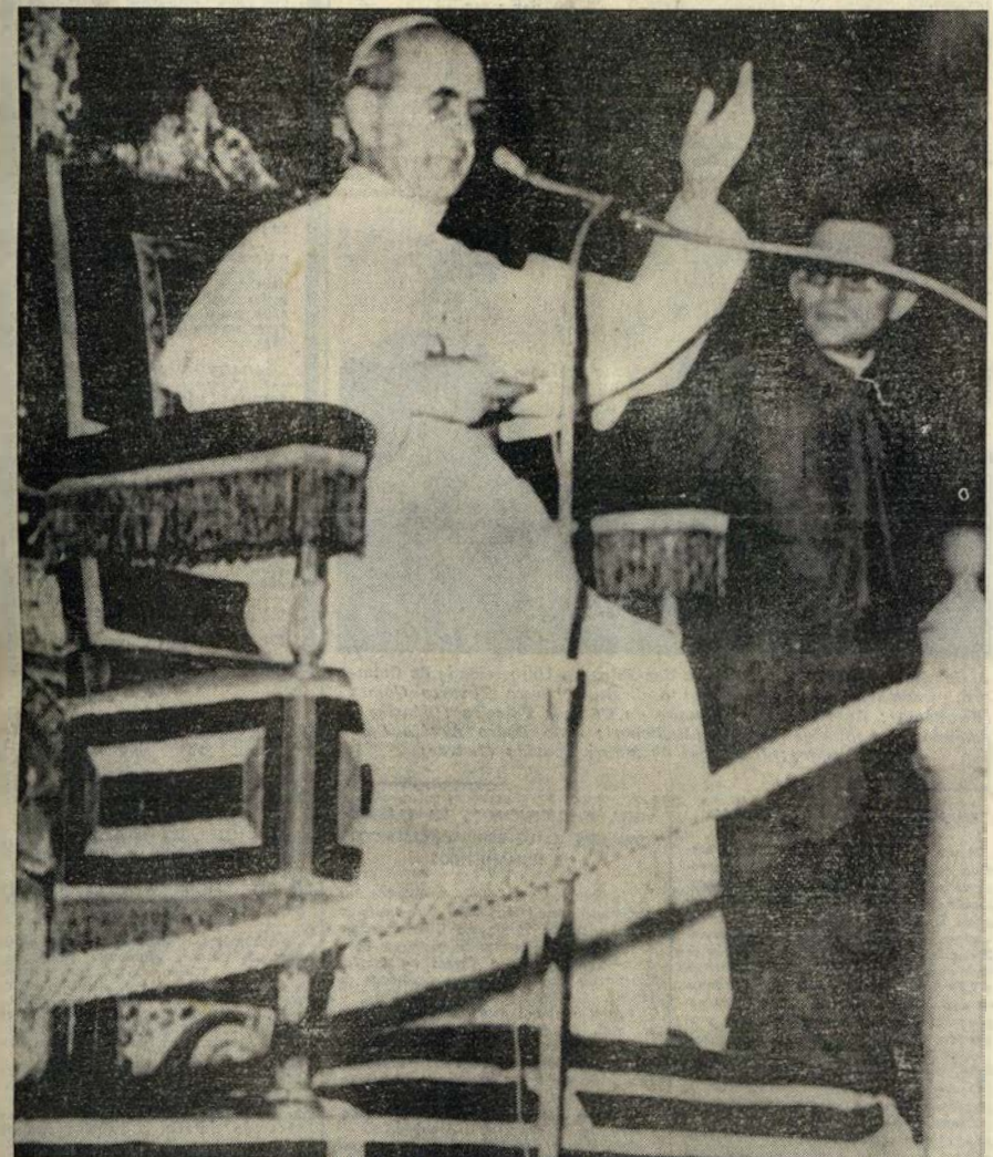
Sua Santidade o Papa Paulo VI anunciando, ontem, na Basílica de S. Pedro, durante a audiência geral, a decisão de vir a Fátima para se associar aos actos comemorativos do Cinquentenário das Aparições