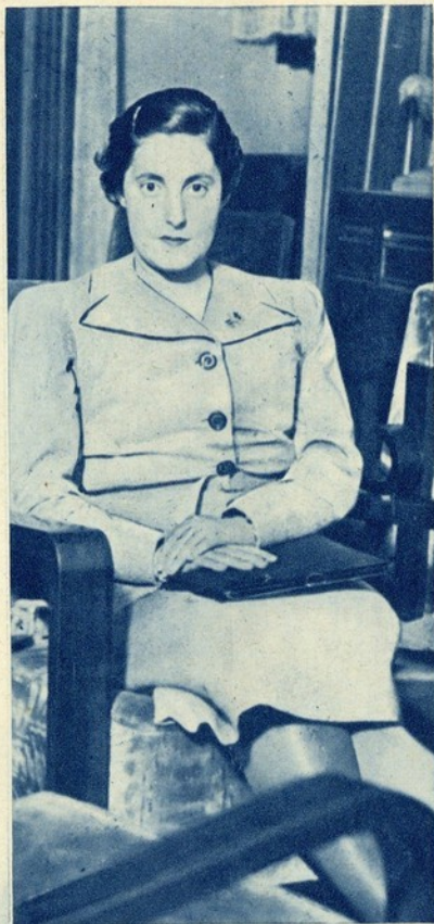
PILAR PRIMO DE RIVERA Chefe Nacional da Secção Feminina da Falange Espanhola

E se não faltou quem tratasse dos feridos, foi ainda porque as raparigas e as mulheres da Falange deixaram a sua casa para prestar serviços nos