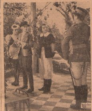
Camilla Horn com todo o seu encanto, Louis Graveure com a sua esplendida voz...