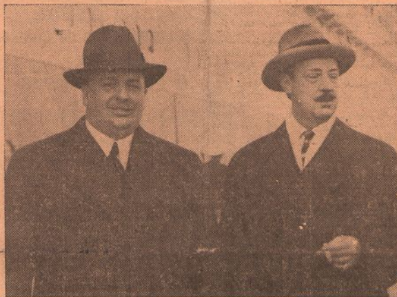
O ministro da Fazenda do Brasil com o embaixador do seu país, sr. dr. Guerra Juval

O «Cap Arcona» atracou aos cais de Alcântara pelas 5 horas. E ainda não eram 7 quando surgiram no «deck» superior, donde estiveram largamente admirando o panorama da cidade, duas figuras que se destacavam dos numerosos passageiros do transatlantico.