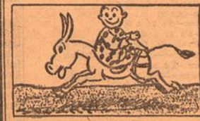
VI—... e o burro—que é burro—corre para a frente.