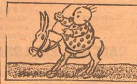
III—Por mais que Manecas se estafe, não ha maneira de o animal andar para a frente.