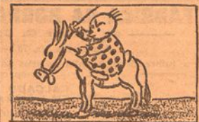
II—O burro, porém, é teimoso.