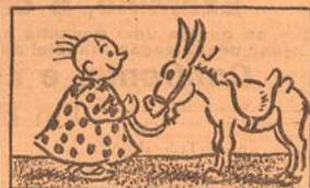
I—Manecas vai a Cacilhas para dar um passeio.