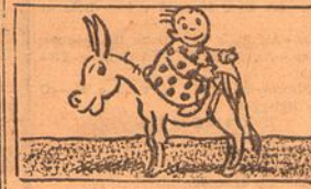
V—... monta ao contrario...