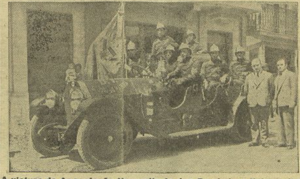
A viatura da Associação Humanitaria dos Bombeiros Voluntarios de S. João da Madeira, que tomou parte no cortejo de ontem