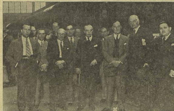
Malcolm Campbell com as pessoas que lhe apresentaram cumprimentos de despedida na gare do Rossio

No «sud express» partiu hoje para Paris, de onde segue para Londres, sir Malcolm Campbell, o grande corredor automobilista inglês que desde ha dias se encontrava entre nós, a convite do Secretariado de Propaganda Nacional.