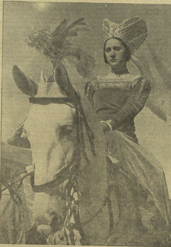
Uma linda amazona que figura no cortejo de hoje

Uma revocação admirável de Leitão de Barros atravessa as ruas da capital num cortejo de beleza deslumbradora