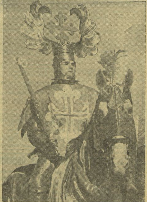
Um soldado de Cavalaria 7 que representa no cortejo a figura de Nnn'Alvares