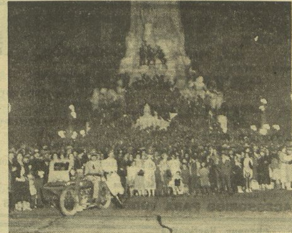
O monumento do Marquês de Pombal, em 1880, assaltado por um multidão, impacientes por ver as marchas, que em densos cachos, a encheu duma inedita figuração de estatuas, dum rico e real piteresco