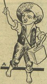
Beatriz Costa em «Espanta-pardais»