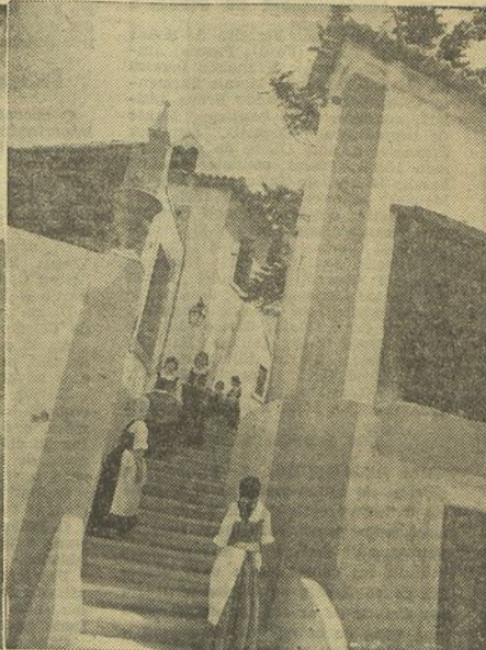
Dois aspectos pitorescos do bairro de Lisboa Antiga, nos terrenos do antigo convento das Francesinhas

E já na próxima terça feira que a velha Lisboa, do século XVIII, outra cidade cheia de pitoresco e de evocação, traçada e embelezada por Matos Sequeira, numa admirável retrospectiva, franqueia as suas portas. Matos Sequeira não quiz apenas evocar um trecho ciadino, com as suas ruínas invias, os seus templos joaninos, os seus palácios de antanho, mas animá-la, humanizá-la, ressuscitando usanças e costumes da época, trajos, tipos e folgoedos, com características bem marcadas. Assim, entre os atractivos dessa velha Lisboa, figuram os cegos, uns vendendo folhetos de cordel, outros cantando xacaras.