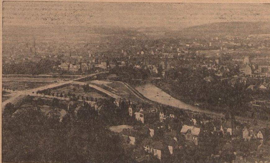
Um aspecto panoramico de Sarrebruck