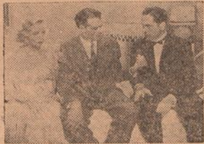
Miriam Hopkins, Gary Cooper e Frederic March

E' amanhã, finalmente, que o São Luiz apresenta "Uma mulher para dois, a celebre comedia de Lubotsh que tanto exito alcançou, em Paris, e que os criticos francezes classificaram, em primeiro lugar no inquerito organizado por "Cinemédias", para apurar qual o melhor filme do ano.