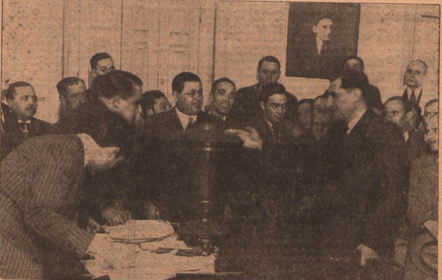
O sr. presidente do ministerio exercendo o direito de suffragio na assembleia de Arroios