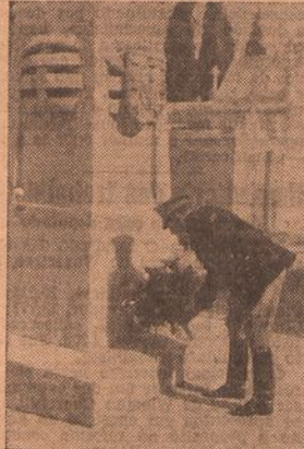
O sr. ministro da Guerra depondo flores no monumento das vitimas do 7 de Fevereiro