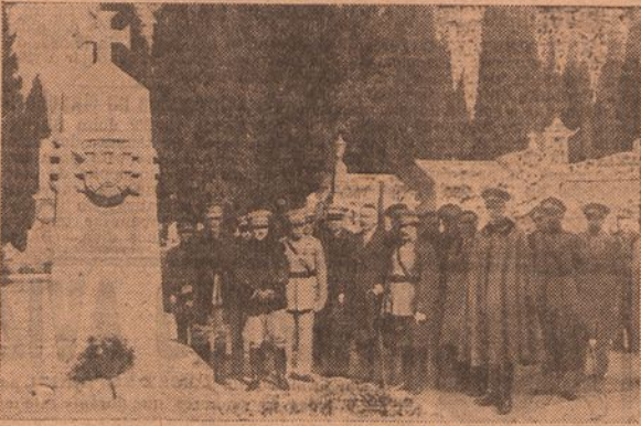
As entidades officias no cemiterio dos Prazeres

Durante a tarde, varias deputações dos regimentos da capital e pessoas de familia dos soldados mortos, foram all, igualmente, depôr flores.