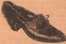
Sapato para senhora "Lusbel."