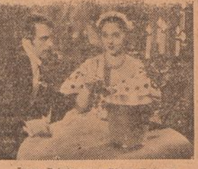
Vivone Printemps e Pierre Fresnay

Poi muito além da expectativa o exito, absolutamente triangular, ontem obtido pelo novo foliame «A Dama das Camélias», que o Odeon, Palacio e Politeama estrearam. Uma pleiade