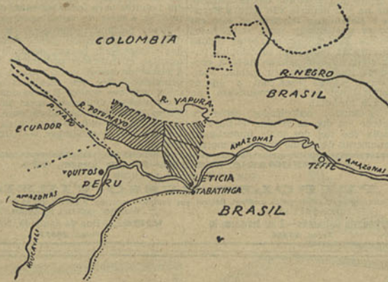
Gráfico da região onde se está travando a luta entre a Columbia e o Peru. A zona tracejada da esquerda foi cedida ao Peru pela Columbia, que recebeu em troca a zona tracejada da direita onde está situada Leticia—o pomo da discordia

BOGOTÁ, 20.—A comissão brasileira encarregada de estudar o conflito suscitado entre o Peru e a Columbia, segundo consta, chegou a Taracá no paquete brasileiro «Affredosa».—(Havas).