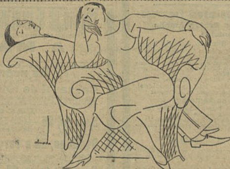
ELE - Que deliciosos estes dias no Estoril! ELA - E' verdade. Como natureza bruta, não ha melhor - nem nas ilhas da Oceania, que nós vemos no cinema.

A FOLHA official publica hoje um decreto colocando os professores de ensino superior num regime de faltas adequado á natureza especial da função que lhes cumpre desempenhar.