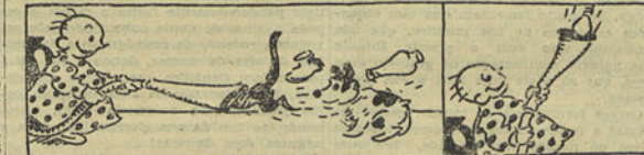
IV — O aparelho vai aspirando o fareco, o Piloyo, botas, candeieiro, tudo... V — ... e até a pôra electrica engole!