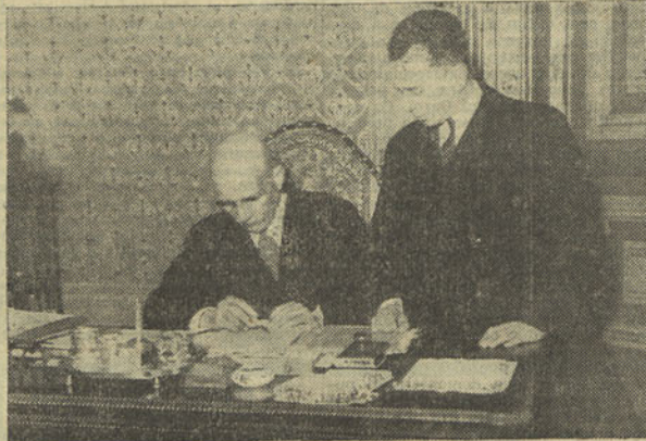
O sr. general Vicente de Freitas ainda hoje despacha no seu gabinete da Camara

Os jornais da manhã publicaram hoje uma nota officiosa em que se diz que o governo autorizou há dias a publicação de uma exposição do sr. general Vicente de Freitas, sobre a organização politica e a reforma constitucional, em obediencia ao criterio estabelecido de livremente se poder discutir na Imprensa o projecto da nova Constituição.