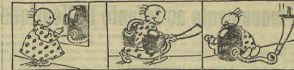
I — Manecas vê, na mostra dum ferrolheamento e compra o aparelho... II — ... entra no estabelecimento e compra o aparelho... III — ... e, ao chegar a casa, liga-o á corrente electrica.

Praça de Camões, 6, 1.º — Consultas ás 16 horas