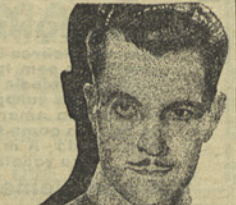
RAMON NOVARRO EM ALVORADA DO AMOR