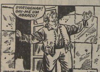
2—Atraído pelo ruído, Porthos apareceu à porta e, reconhecendo o seu visitante, solta um rugido de fazer estremece os vidros. Porthos continua a ter a mesma gigantesca estatura e o seu rosto, um pouco ingênuo, é ainda sorridente.