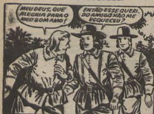
1—Precedidos de Mousqueton, que caminha vagarosamente, devido à gurdura, D'Aragnan e Planchet dirigem-se para o castelo onde habita o senhor de Vallon de Bracioux. Pierrefonds, outrora conhecido por Porthos...