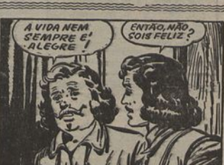
4—Acalmados os ferozes transportes de Porthos, D'Aragnan toma a respiração e informa-se da saúde da senhora de Vallon. Porthos assume então um ar grave e anuncia ao amigo que sua esposa faleceu há já dois anos e que a vida é agora triste para ele.