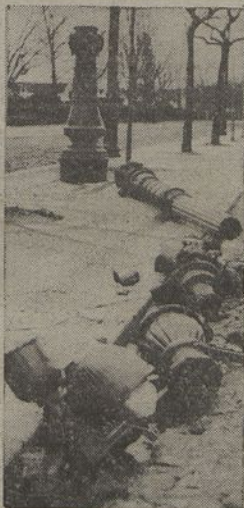
Ficou neste estado um candeeiro da Avenida 24 de Julho, por alturas da Praça D. Luís, que a ventania derrubou