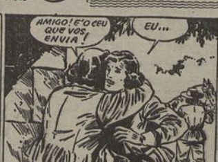
3—O caloroso acolhimento do bravo Porthos contrasta com a desconfiança de Aramis, e D'Aragnan sente-se reconfortado com o vigor do abraço que recebe. Porthos continua a ser forte...