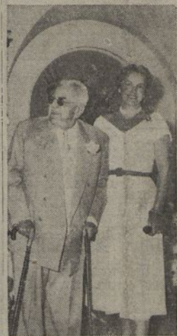
Após uma enfermidade relativamente grave e que durou toda a Inverno, o Aga Khan, ao lado de quem vemos a sua ainda bela esposa, criou coragem para se erguer da cama e sorrir aos anúncios da Primavera. Esta, menos corajosa do que o famoso milionário, e que parece não criar forças para expulsar o Inverno...

CHHIM (Libano), 18 — Brigadas de Polícia, bombeiros e soldados estiveram ontem à procura de corpos nas ruínas das casas que se desmoramaram devido aos terramotos.