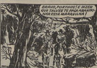
2 - D'Artagnan fica também a saber que Porthos, com a sua mania das grandezas, acrescentou ao seu nome os das suas terras. A sua ambição - pensa o gascão - será motivo para aceitar a proposta que vai fazer-lhe.