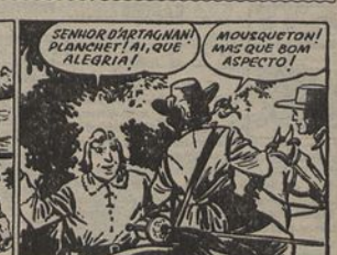
4 - A atitude respeitosa desses camponeses faz D'Artagnan pensar que se trata de Porthos, deixando-se admirar pelos subditos. Mas reconhece depois que é o bravo Mousqueton, gordo e anafado, respirando saúde. Reconhecendo-o, Mousqueton desce do seu burro com a leveza de um cefalópode. (Continua)