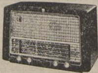
Modelo BX 645 A