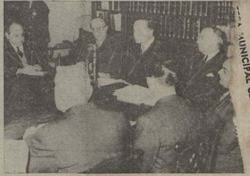
O Ministro das Corporações, falando aos jornalistas

Ontem, começou a cair uma chuva miudinha e hoje, de manhã, o frio continuava a ser intenso, embora tenha diminuido de ontem para hoje. A relva está molhada, o que dificultará a acção dos concorrentes. O sorteio efectuado esta manhã deu o seguinte resultado: Inglaterra, á corda, depois Espanha, Escó-