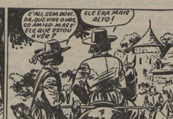
3 - Os dois viajantes chegam daí a pouco diante de um encantador castelo, rodeado de um grande parque. A entrada há um portão monumental, diante do qual está um indivíduo montado num burro e cujo vestuário de dourados parece encantar um grupo de camponeses que o rodeia.