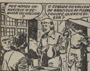
1 - Sabendo agora o que devia pensar de Aramis, D'Artagnan, seguido de Planchet, dirige-se para as terras de Porthos, na Picardia. Em Villers-Cotterets informam-no do local da residência do amigo.