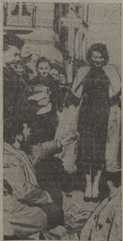
Sophia Loren, de visita a Paris, rodeada por um grupo de admiradores do bairro de Saint-Germain

O Colégio de Santa Catarina, em Ontário, há três meses que se jogavam dos feitos de um dos seus jogadores de hóquei em gelo. Dos nove jogos em que tomou parte, a equipa do colégio ganhou cinco, devido, sobretudo, á pericia de Abigail Hoffman. E por essa razão o seu nome foi indicado para a selecção de juniores do Canadá. Ai é que principiam as dificuldades, porque havia umas pequenas formalidades a cumprir. Abigail tinha de apresentar a certidão de idade, por exemplo. E esta mencionava o facto de se tratar de um individuo do sexo feminino! Tratava-se de uma inocente mascarada. Abigail era, de facto, uma rapariga de nove anos de idade, dominada pela paixão do hóquei, convencera a familia a deixá-la passar por rapaz para poder jogar na equipa do Colégio de Santa Catarina.