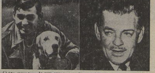
CLARK GABLE — As suas aparições na tela são hoje raras, mas eu... vem o mesmo brilho que valearam no famoso «astros» o seu título de «rei». Clark Gable tem agora 55 anos. Fez o primeiro filme em 1921. Dirigido três vezes, viveu outra (de Carole Lombard, morta num desastre de avião), voltou a casar-se o ano passado. A foto da esquerda mostra-o, em 1939, no seu estupendo criação em «E tudo o que levamos», filme celebrado em todo o Mundo e que teve uma receita de 35 milhões de dólares!