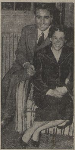
Miquel Essayon, nota do Gulbenkian, o famoso «Rei do Petróleo», que deixou o seu nome ligado a Portugal, vai casar-se com Geraldine Guinness, filha do celebre e ass do automobilismo mundial, Kenoly Lea Guinness, já falecido, e que em 1921 estabeleceu a «recorda universal» de 180 quilómetros à hora, em estrada. Miquel Essayon e Geraldine Guinness, que vemos juntos, na casa do primeiro, em Londres, têm, respectivamente, 28 e 23 anos. O casamento foi anunciado para Maio próximo, em Westminster, devendo assistir mais de 1.000 convidados