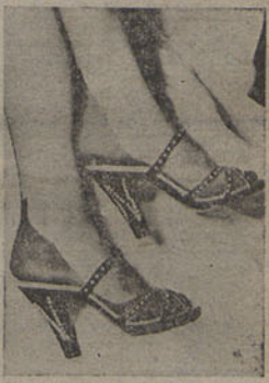
A grande moda deste Inverno são os sapatos género sandália, para vestir de noite, em uantina preta, tendo aplicações a branco. As senhoras que queiram andar à moda mandam aplicar nos tacões a primeira letra do seu nome

mas, que teria sido de nós e da caravana que nos seguia? Finalmente, após caminhar horas e horas através do Tchironjamba, surge-nos a pri- (Continua na 3.ª pág.)