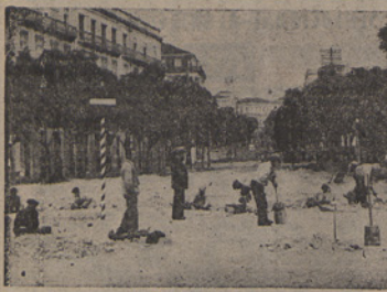
Aspecto das obras na Avenida D. Carlos I, no trecho compreendido entre Avenida 24 de Julho e Edifício Marquês de Almeida, que constituem a primeira fase de trabalhos e execução em toda o eixo arterial central. Desde agora, desde a Avenida 24 de Julho até ao Largo Junco da Assembleia Nacional, toda a Avenida D. Carlos I ficará aberta.