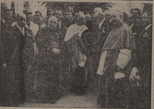
O Cardeal Legado, D. Manuel Gonçalves Cerejeira, com as entidades oficiais espanholas e portuguesas na fronteira do Caia