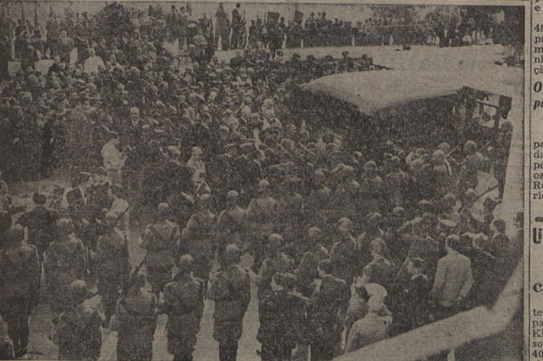
A colocação das Relíquias de S. João de Deus no autocarro que as transportou até Montemor-o-Novo