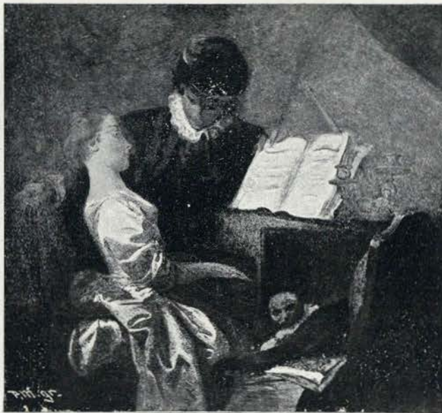
LE LEÇON DE MUSIQUE

A sua arte decorre parallela com a dos mestres donorte, vagamente influenciada pelos grandes coloristas venezianos, mas sem subserviencias, antes individualisada por fórma que a interpretação da figura, o character da payagem, a côr e a impressão — processo summario já percorridor das escolas impressionistas contemporaneas —, collo-