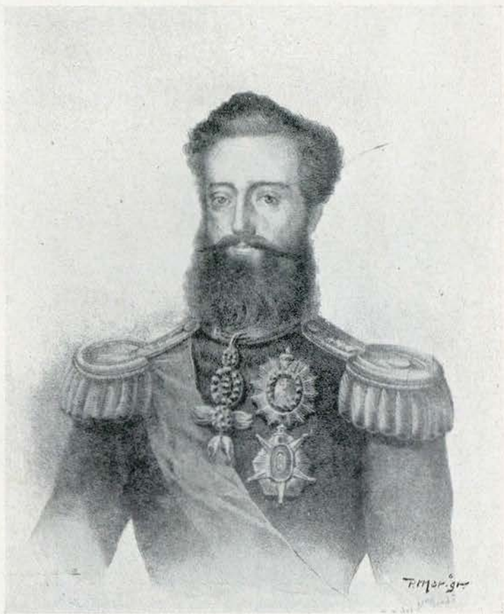
D. PEDRO IV