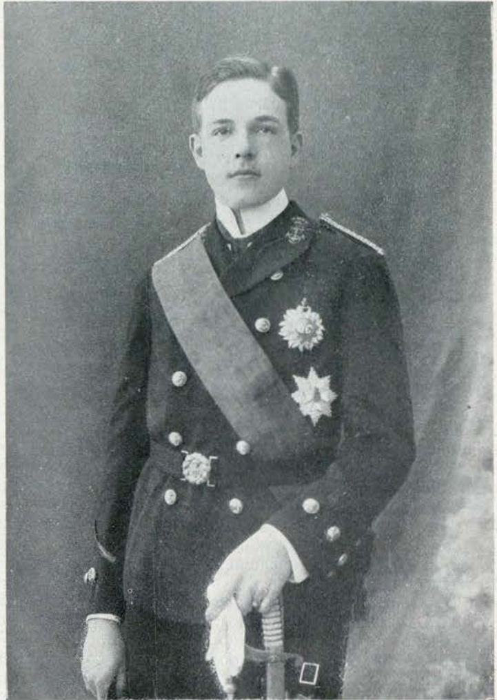
D. MANUEL II

No nosso ultimo numero já nos referimos ao apoio que a Grande Orchestra Portugueza encontrou no Senhor D. Carlos. E igual confissão póde ser feita por muitos outros artistas portuguezes. Ainda no dezembro ultimo, quando em Villa Nova de Gaya Antonio Teixeira Lopes festejava as bodas d'ouro de seus paes, o defuncto monarcha lhe enviou a mais to-