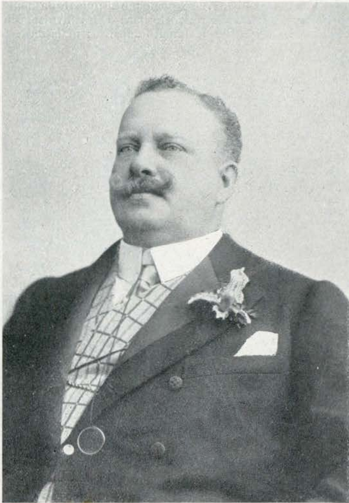
D. CARLOS I

Passando por Paris, em Novembro de 1867, D. Luiz visitou o velho Rossini, e muito fallaram d'essa visita artistica os jornaes do tempo. Então ainda o cisne de Pesaro, como usavam chamar-lhe, conservava por toda a parte muitos e ardentes adoradores. Hoje, que tudo mudou em materia musical, temos nós porém o feliz ensejo de revelar aos leitores da Arte