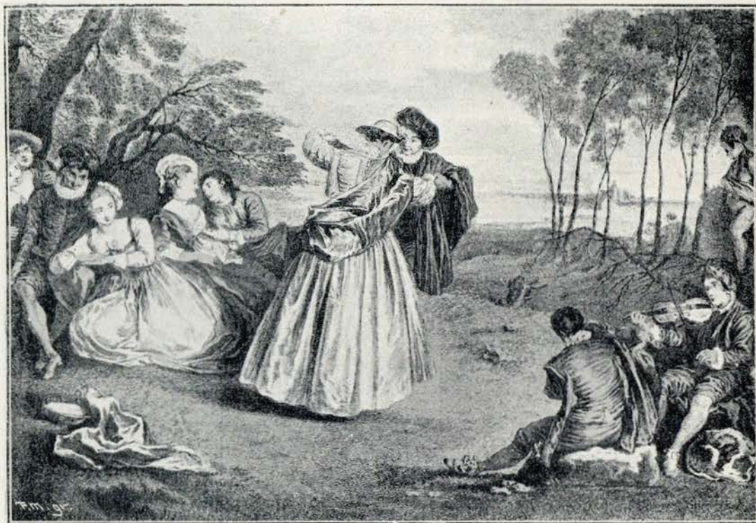
WATTEAU — LA CONTREDANSE

Acompanhando a sociedade franceza durante o periodo de gestação d'uma das maiores convulsões sociaes que a historia regista, a arte do seculo XVIII reflecte admiravelmente os requintes d'um mundo, que tinha o vago instincto da hora derradeira já muito proxima, e que, na febre do prazer, na vertigem d'uma vida que foge, illudia os signaes do destino inexoravel e impiedoso.