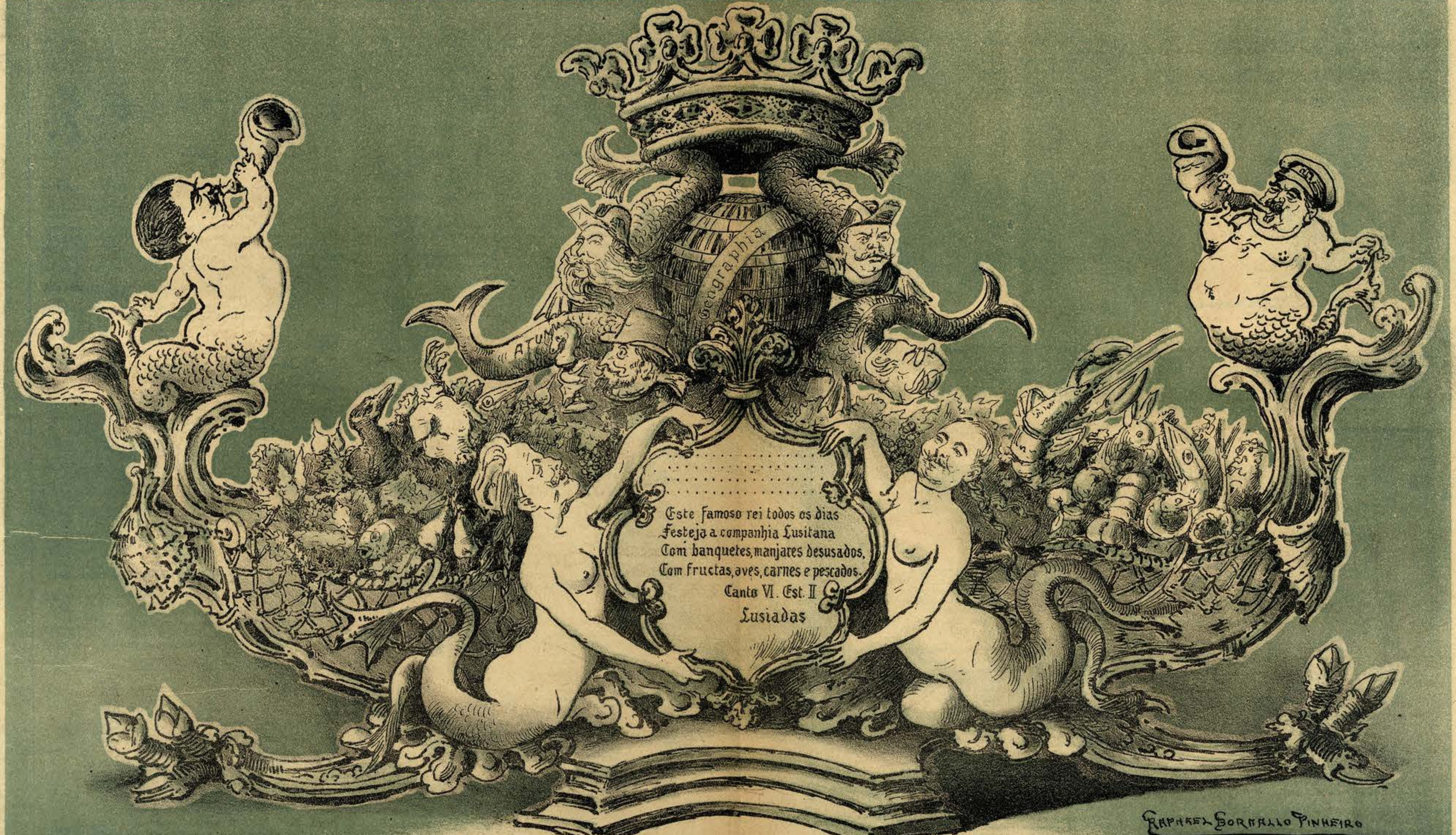
Projecto do centro de meza em prata ... da casa, —offerecido pela PARODIA em commemoração do Congresso Marítimo