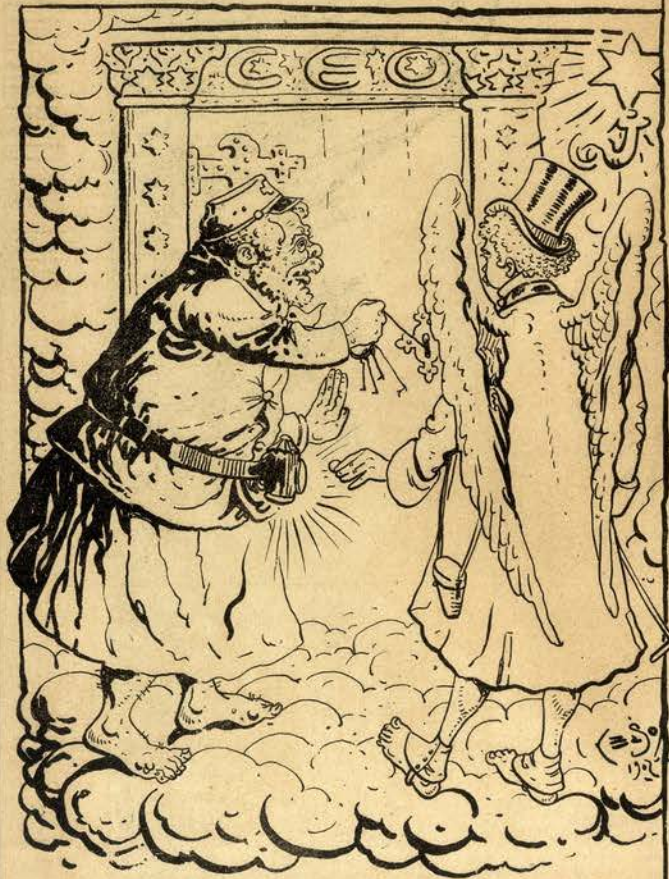
S. PEDRO — O guarda-nocturno da celestial mansão.