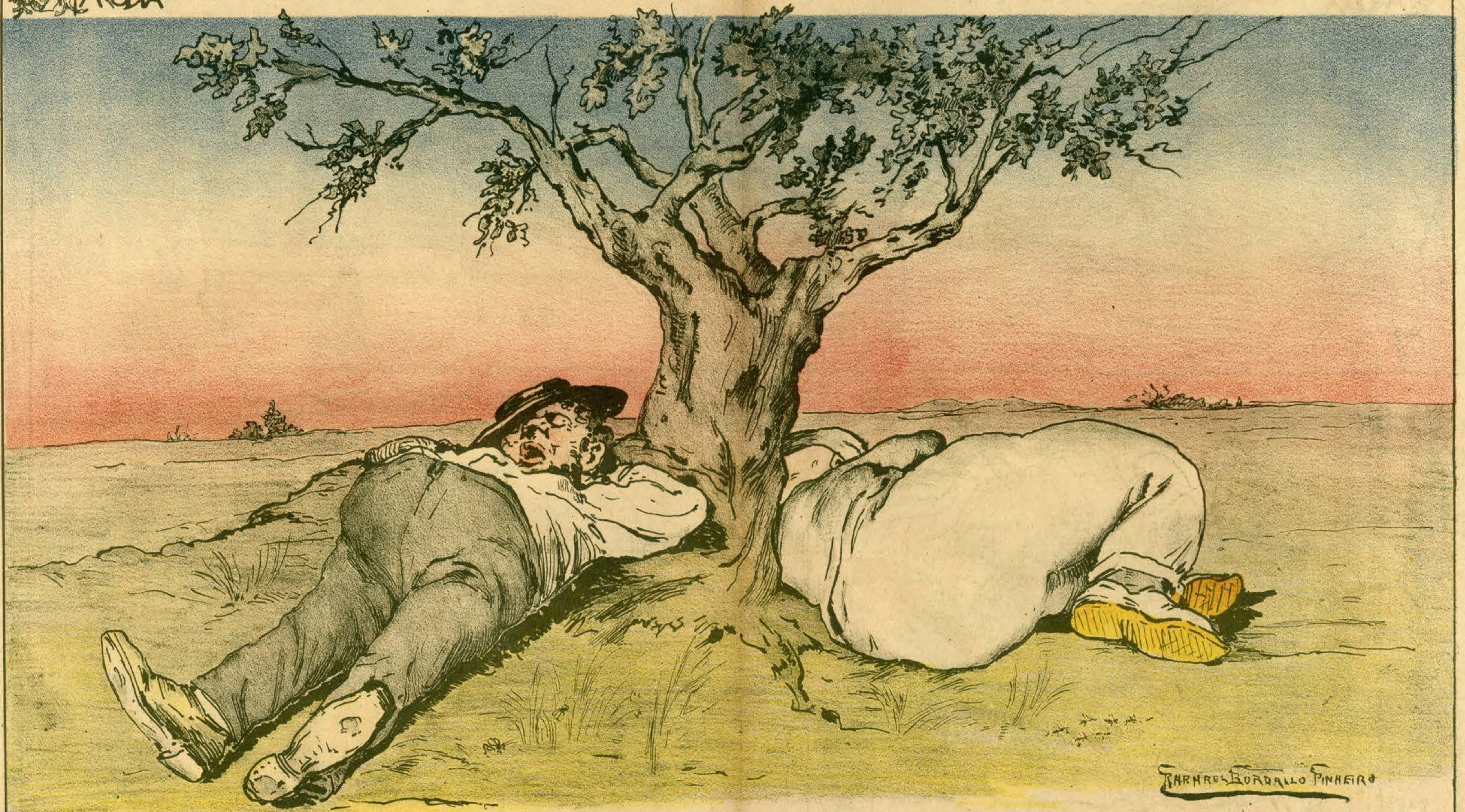
À sombra dos Immortaes Principios — As duas soberanias.