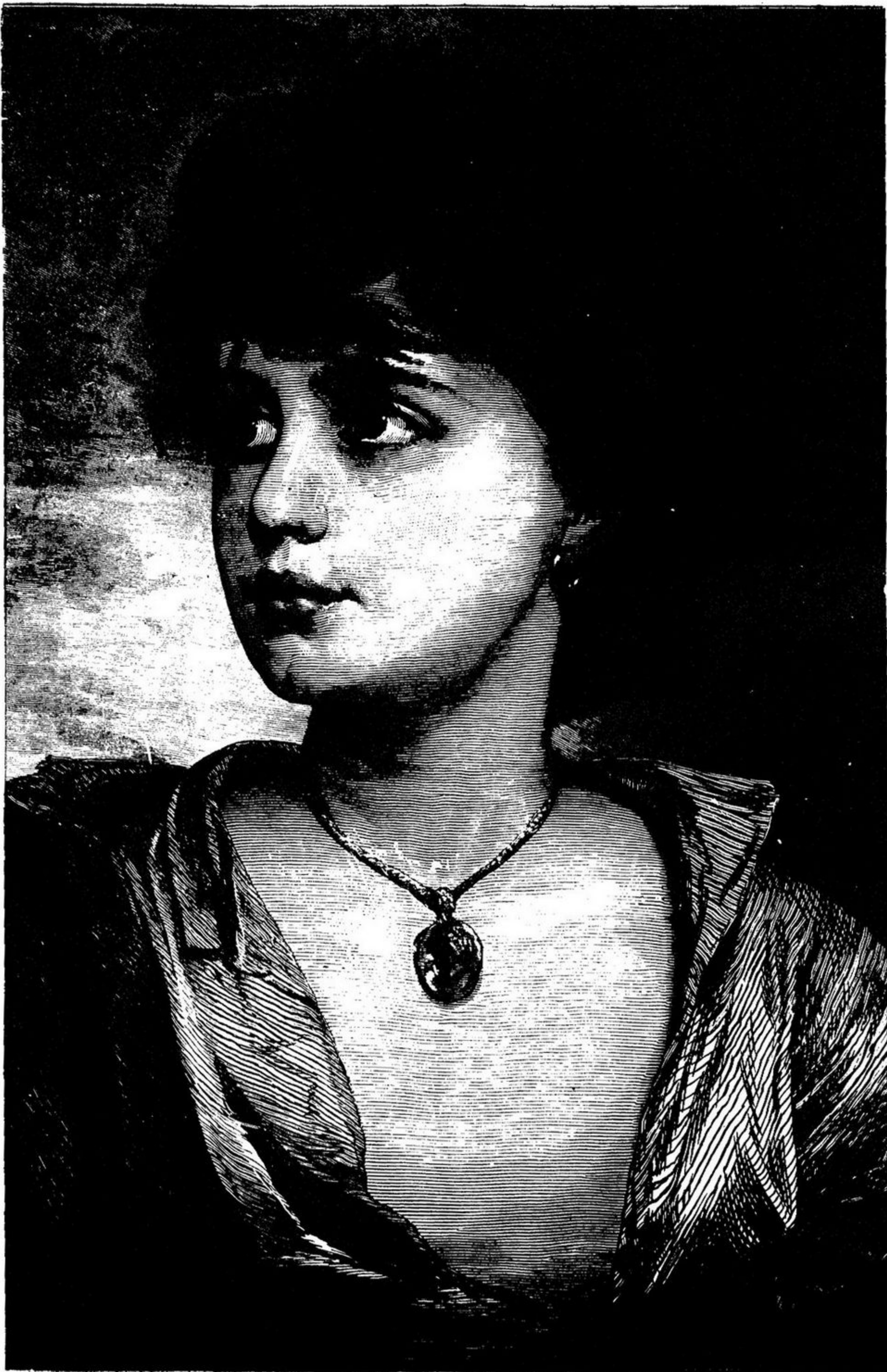
UM GALATO NAPOLITANO