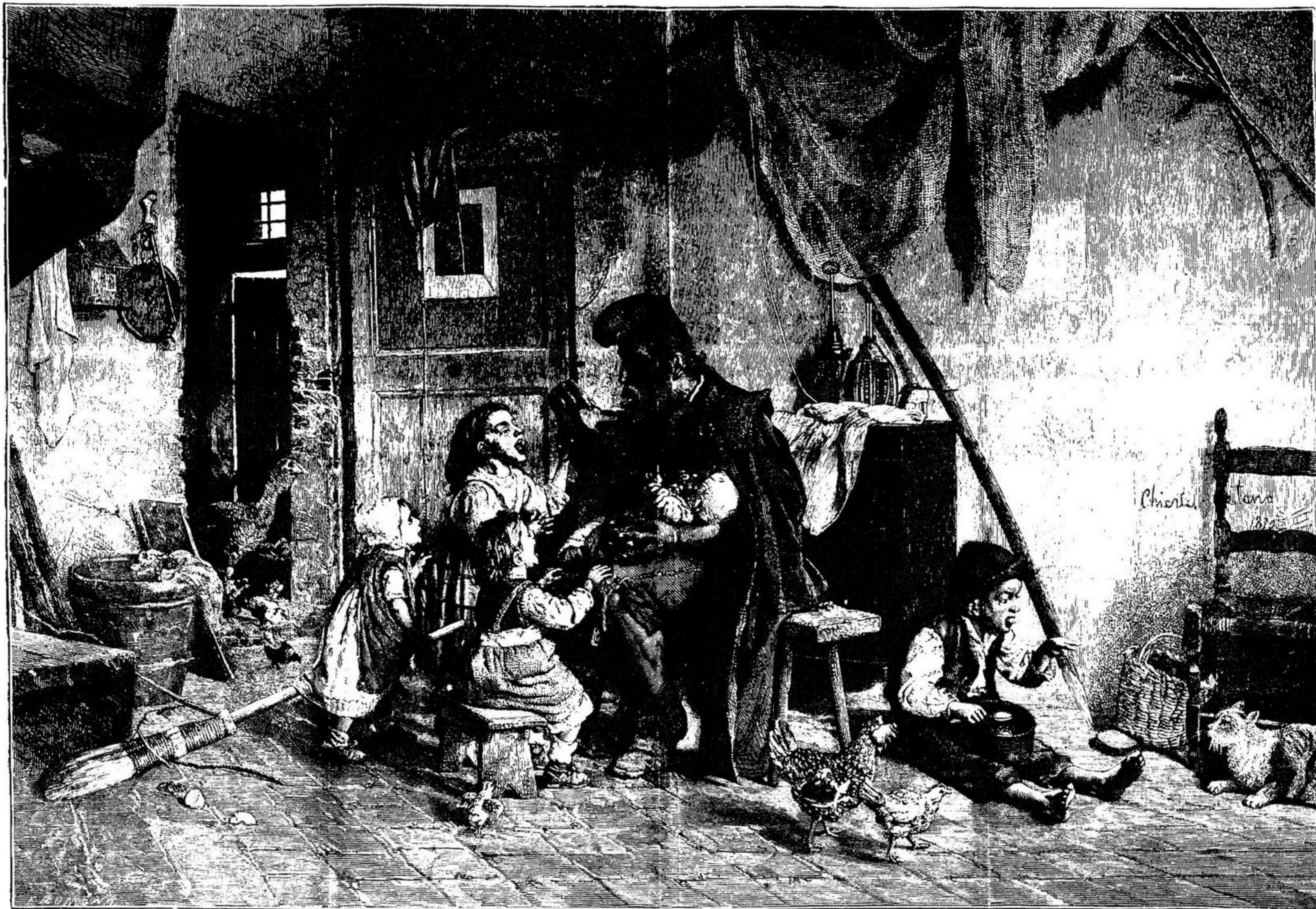
A MÃE DOENTE