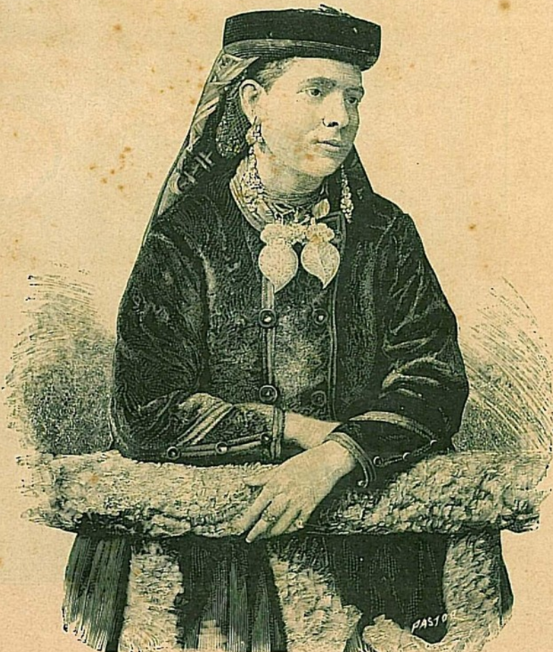
UM COSTUME DO MINHO

A Hespanha, com 14 milhões de habitantes no continente europeu e com mais 36 milhões de homens fallando a sua lingua