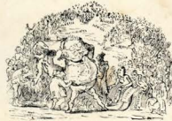
2.—MAGA SAPARITURUS Parviti oculi, suberitit, pteriti, acclitit, et tili quanti, in magis comitatus ceteris currenti dicit censuri (Viti Lantevi ad abdicandorum potestati- dian.—Venti a solo o vento reitio.

Ministru choramifugibus Iam, nobis gradibus Et loco mansuetorum Tratitv inventare.