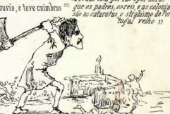
Nota do Ed. A ordem segna avestimar-he... a cabeçal