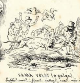
SANTA VOLTA O GALÃO