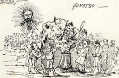
seremos as MASCARAS da Civilização.