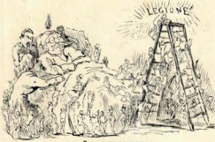
3.—MAGIS DE SACRO Rei de corus (acordando).—Ereita, ereita? Rei de copis.—Quid dicit? Inve est gressus? Rei de corus.—Gracius ostendit ego, sed colatit legis vultu stragulationis motus. Rei de copis.—Fiat voluntas tua.