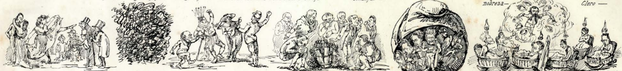
moral, — ensino, — governo — Tudo está, — tudo assim corruptissimo! — Nós... — tivemos uma visão redemptora e de encresta;