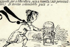
n e supposto que a litteratura seja a ramada (não personalizamo) de mesmo comolente paiz "