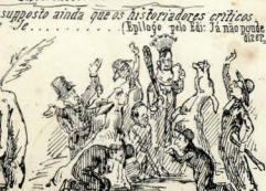
Viva a liberdade!!!