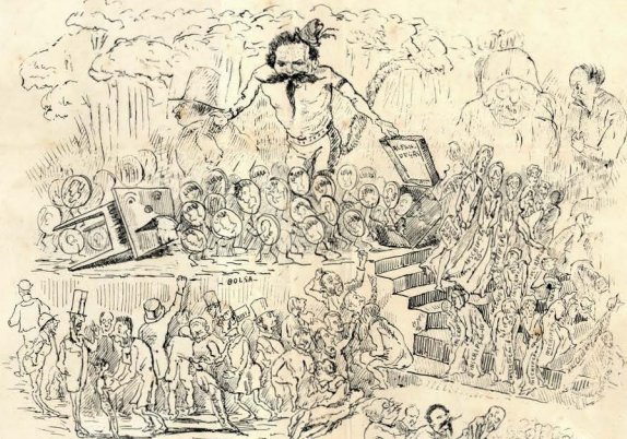
8.—MOTO CLAVI DE MOTO. Un prestidigitator.—Frasco, pennis! Linguistio gratulit! (Inscriptiones, Corno) Invenitit, decoreto, decoreto, Corno da Bona.—Miserere mei, Deo! Invenitit miserandit cum pedis paritit, in grande arvionis ostendit tu.—Un pennis.—Rogitit pennis, vult ego comperit a mitis, invenitit amita barata? —No, a 20, a 10, a 5, a nada! —No, No, Min adit quere vult populi de a 10.—It is good for nothing!...