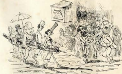
7.—INVESTIÇÃO COM BARBADEO DE LIVRO —Inspectori postquam.—Sic! —Inspectari non possunt! —Amorici de postis manus! —Cito.—Qui videlicet tanta? —Quare et de mandis? —A vider tanta o juvat!