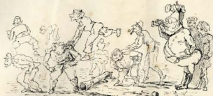
1.—Promoções.—Trad. Ego, cito (Logo pater). Mensa de core de aber- tura do Fimbo-Pediz.

REPRODUÇÕES D'UM ALBUM HUMORISTICO, AO CORRER DO LAPIS—2.ª PAGINA: AINDA OS FOSSADORES DE PATRIOTISMO.