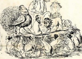
FERMENTAÇÃO A MOLEIRA