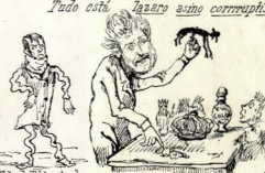
Nota do Ed. A ordem que as patras, cores, e as colojas — do a cultura, e a situação do "br" — "refo" refo "