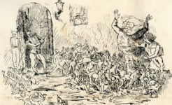
5.—In a vintemagnum! Trad. livre.—Balan as comitatus —Tu quosque Brati. Trad.—A mass crinatus tua respectu!