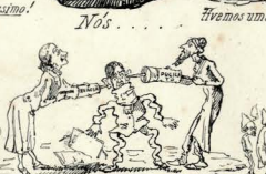
Nota do Ed. A ordem tremulenta concebeu uma roba.