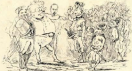
4.—Legio Mansuetorum, mansuetorum, mansuetorum Ego pater eius et mansuetorum aliquid de defendendum Trad. livre.—Aqui está quem guarda a vobis.