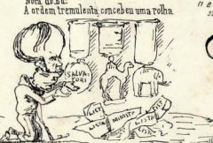
Nota do Ed. A ordem teve ancias e desejos.