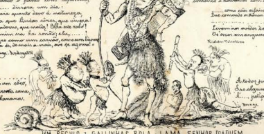
UM REGUO DA GALLINHAS BOLA E LAMA SENHOR DAQUEM E D'ALEM MAR EM AFRICA