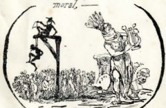
se nos permitir o ardeite e arte,