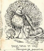
SANTA VOLTA O GALÃO