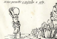
Nota do Ed. A ordem segna avestimar-he... a cabeçal