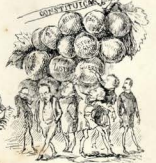
O CAHO O MINISTRO