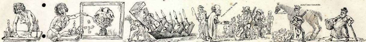
Semboras : — esta é a parvidade e burquesa physionomia do país, — esta a sua catholica e monarchica situação : — finanças — povo — nobreza — Clero —

— 7.ª Pagina — Conferencias Democraticas —