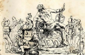
FANNO DA AMOSTRA