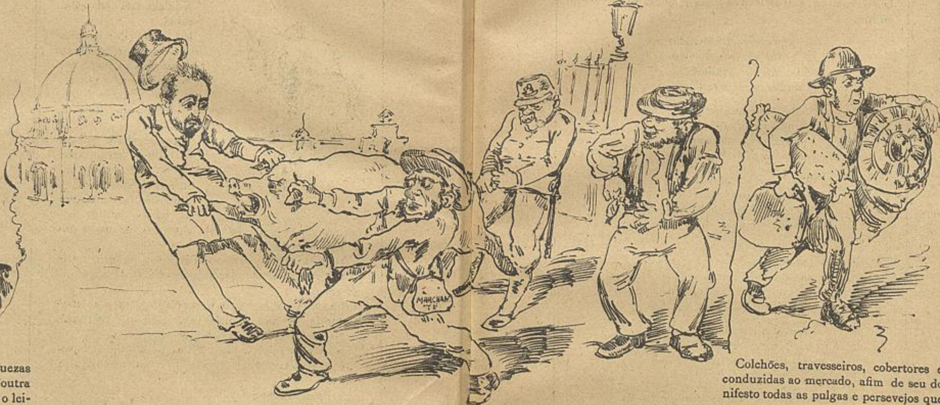
Colchões, travesseiros, cobertores e almofadinhas conduzidas ao mercado, afim de seu dono dar ao manifesto todas as pulgas e persevejos que vac matar.