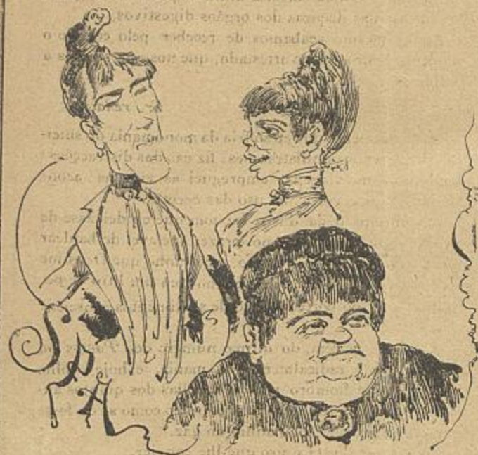
Verdadeiros retratos das duas gentis portuguezas premiadas no concurso de belleza de Spa, e d'outra que não foi mas podia ter sido. Estamos a ouvir o leitor dizer: —Olha quem ellas são!...