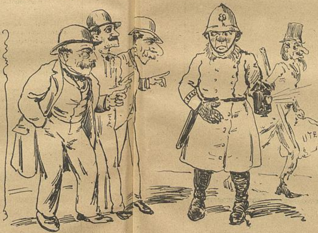
Triste figura de um policeman inglez anto os Argus da travessa da Precirinha.