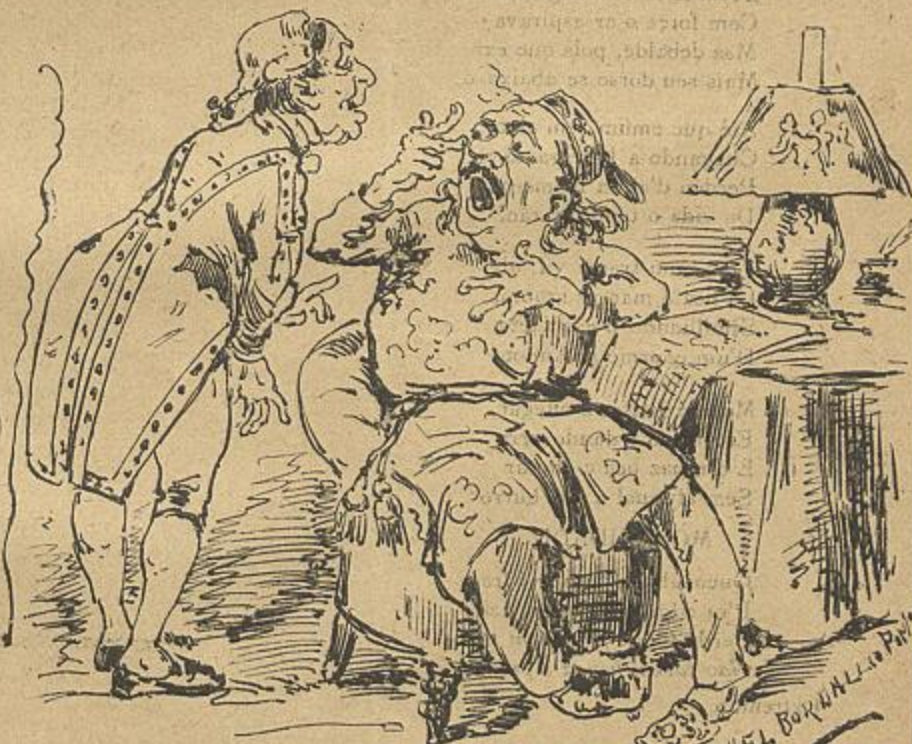
—Então v. ex.ª não sac hoje? ha que noites que não pôc o pé na rua!... —Nada d'isso! A policia ingleza ainda não apanhou o assassino das mulheres e quem sabe se elle terá vindo para Lisboa... Cruzes!...