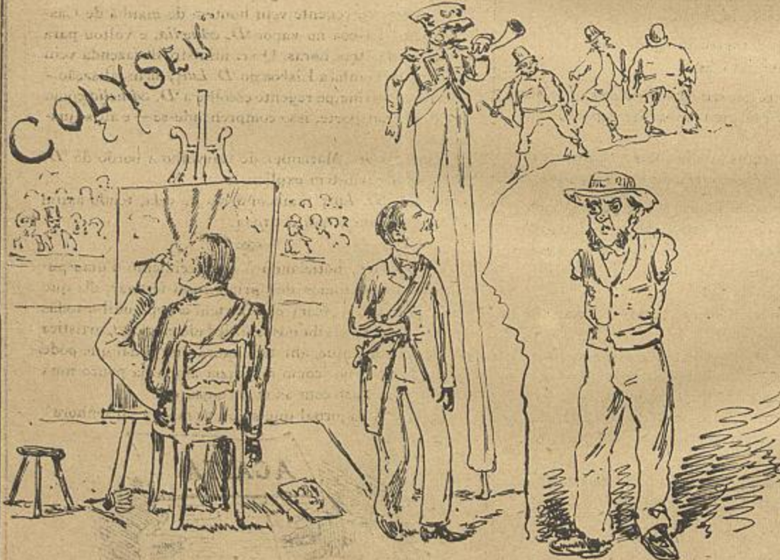
No Coliseu. Homem que pinta com o pé esquerdo, muito melhor de que outros o fazem com a mão direita. N'um paiz que tanto se resente da falta de braços, deve o governo subsidiar os que forem ao Coliseu aprender a trabalhar com os pés.